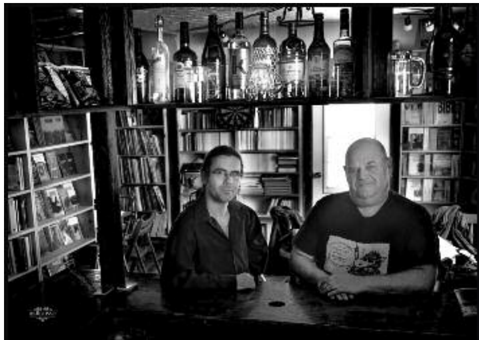
L'ex clown des Bérurier Noir aurait été aperçu en compagnie du robot BB8

Les rendez-vous autour du numérique se multiplient dans la ville, mais celui lancé par le CCO à Villeurbanne propose un angle original : le retour à la langue, considérant que cette dernière est notre tout « premier logiciel de déchiffrement du monde ». Mémoire Vive, c'est son nom, s'attelle autant au big data qu'à la poésie : binaire ou surréalisme ? Ne point choisir.