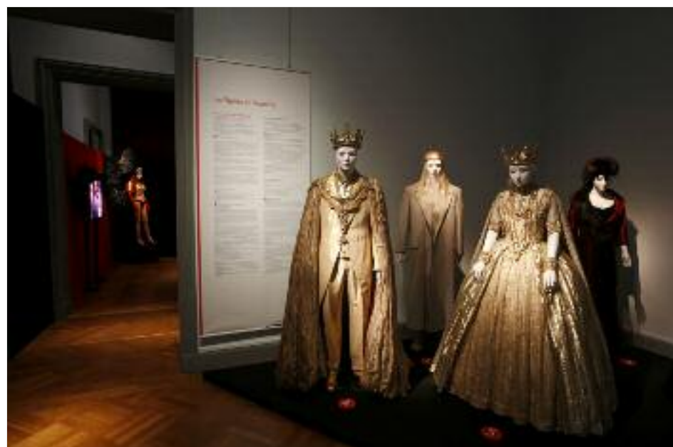
L'opéra de Lyon avait prêté 130 de ses parures pour l'exposition Costumes de Légendes en 2014

Tout débute en 1856, quand les soyeux lyonnais décident de créer ce musée, ouvert au public en 1864. Le temps passant, une collection exemplaire et surtout unique au monde s'est constituée : rien moins que 2,5 millions de pièces de textiles, issues de toute la planète et de toutes les époques, remontant jusqu'à l'Égypte des Pharaons. Un patrimoine inestimable, qui outre le fait d'attirer plusieurs milliers de visiteurs chaque année, d'être particulièrement reconnu à l'étranger (pour preuve, la pétition lancée pour le sauver a recueilli des signatures dans 122 pays), ce musée est une source d'informations essentielle pour les historiens, les créateurs qui viennent y chercher l'inspiration, les étudiants... Bref, un patrimoine unique et irremplaçable représentant 4500 ans d'Histoire.