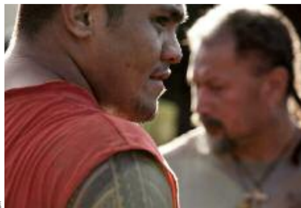
On est un peu à l'étroit, non ?

Sacha Wolff vient du documentaire et cela s'en ressent : il possède cette capacité d'embrasser les atmosphères et cerner les personnages avec une économie de plans et de dialogues subtile – cet art d'aller à l'essentiel en évitant les ornements superflus et l'épate. Aussi erratique que les rebonds d'un ballon ovale, la trajectoire de Soane, son géant ballotté, est avant tout une épopée grandiose à hauteur d'homme : l'on assiste à la construction d'un ado naïf devenant adulte en dépit – ou à cause – des embûches se dressant sur son passage. Un récit d'initiation cruel, où un fils renié par son père parce qu'il ose tenter sa chance sur le continent, se trouve d'un coup arraché à ses fragiles racines – pour un Wallisien ayant déjà migré en Nouvelle-Calédonie, partir vers la métropole revient à accomplir une sorte de "déplacement au carré". Sans jamais choir dans l'éthnofolklore, Wolff offre ici une visibilité cinématographique aux cultures océaniques qui n'en ont guère eue : il faut presque remonter à L'Âme des guerriers (1995) de Lee Tamahori pour trouver dans une fiction le désir de faire partager les coutumes de ces peuples.