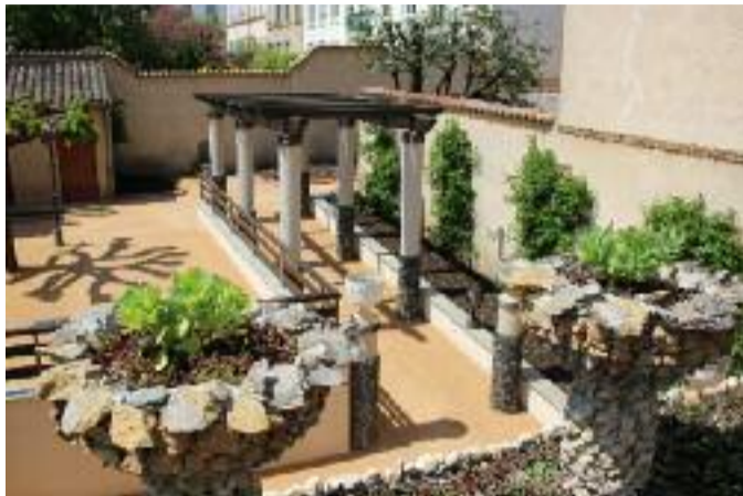
Le Jardin des Curiosités

Besoin de décompresser de la rentrée ? Jetez votre Lexomil et filez au musée. Déambuler dans les allées a le même impact, les effets secondaires en moins : ça détend mais ça n'endort pas. Et surtout, dans chaque musée se loge généralement un petit coin discret où réviser au calme. On se hisse au 4 e étage du Musée des Confluences où se niche Le Comptoir Gourmand, un café doté d'une déco qui appelle à la rêverie (les lampes en forme de nuage n'y sont pas pour rien) et qui offre une vue imprenable sur Lyon et la Saône : parfait pour