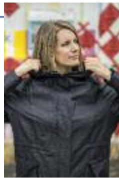
Sonja Moonear

Pour les amateurs de gros rassemblements électroniques, c'est évidemment la direction à prendre ce samedi 8 octobre : l'on parle de la route d'Eurexpo, du côté de Chassieu, où se déroulera une nouvelle édition de Hypnotik, énorme soirée en place depuis... 2001. Concoctée par Elektro System, la programmation est aussi dense que variée (du moins tant que l'on reste dans le domaine purement électro, pas de métissage ici) et convie les incontournables Hadra pour curater la scène psytrance, avec Pixel, Hajja, Kasadelica ou Lucas. Sur les autres scènes, les gros noms s'enchaînent comme des perles et se partagent les ambiances : Recondite, Dominik Eulberg, Kolsch, Ellen Allien, Cabanne, Mód3rn, Roman Flügel... En parallèle, outre la scène trance, l'on notera une scène hardmusic avec les hollandais Audiotricz et Evil Activities. Deux coups de cœur : la valeur ultra sûre Dave Clarke, DJ perpétuellement convaincant, qui clôturera la scène techno. Et Sonja Moonear, qui elle parachèvera la scène dédiée à la minimale. C'est par où, l'after ? SB