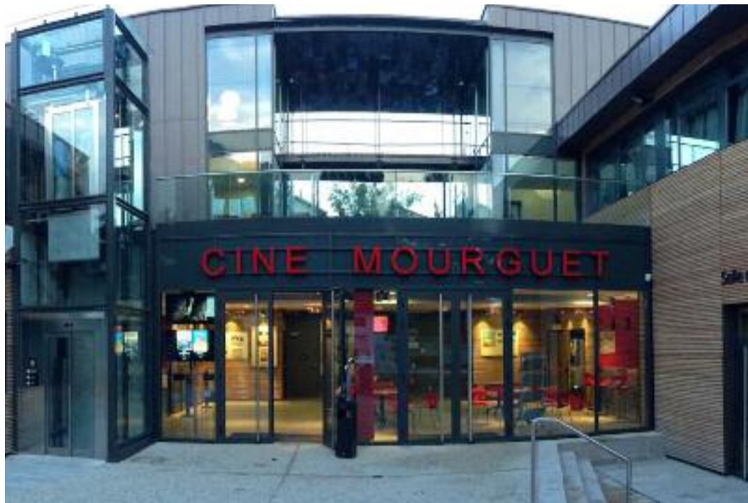
Cine Mourguet

Siégeant parmi les membres de la Commission départementale d'aménagement commercial (CDAC) statuant sur l'implantation de nouveaux multiplexes à l'intérieur ou autour de la Métropole, ils ont eu à instruire ces derniers mois une efflorescence de propositions, défendues comme créatrices d'emplois et de taxe professionnelle. Une vision idyllique des choses, qui omettait cependant de considérer