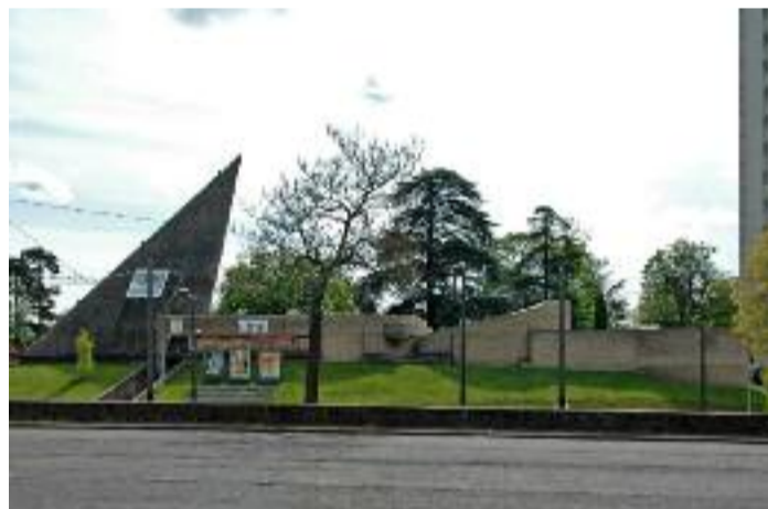
Ciné Duchère