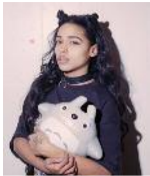
Princess Nokia

Du côté de l'Épicerie Moderne, une rare tentation électro se fait jour avec la présence de Thylacine (le 3 mars). On pourrait aussi