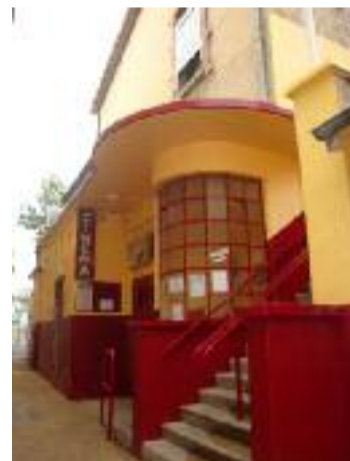
Ciné Saint-Denis © Eralyon - Numeyo.com-lyon

l'environnement existant. Et la mobilisation des réseaux. À Givors, Megarama prévoyait sept salles et 1 300 fauteuils pour 2018 ; le cinéma de Rive-de-Gier a porté recours au national, cette ouverture étant susceptible de le déstabiliser, voire de le condamner comme d'autres indépendants (Mornant...). L'Amphi de Vienne et le CGR de Brignais s'y sont joints... et l'ont emporté face à Megarama - Megarama qui présentait également un projet de neuf écrans à Saint-Bonnet-de-Mure retenu par la CDAC, mais que le GRAC va contester.