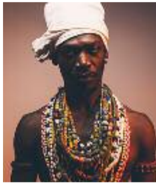
Vaudou Game