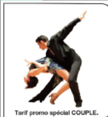
Tarif promo spécial COUPLE.

Choisissez l' EXCELLENCE... pour ENTRER dans la DANSE.