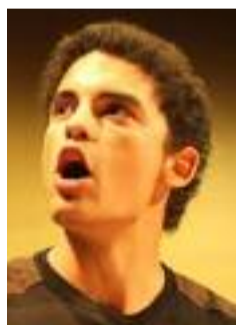
Stéphane de Freitas

On parle plus qu'on écrit. Quand on lit une rédaction, on n'a pas forcément l'intention derrière. Si je fais un post sur Facebook pour dire que c'est très important de dialoguer, des gens vont peut-être mal le prendre car je n'aurais pas