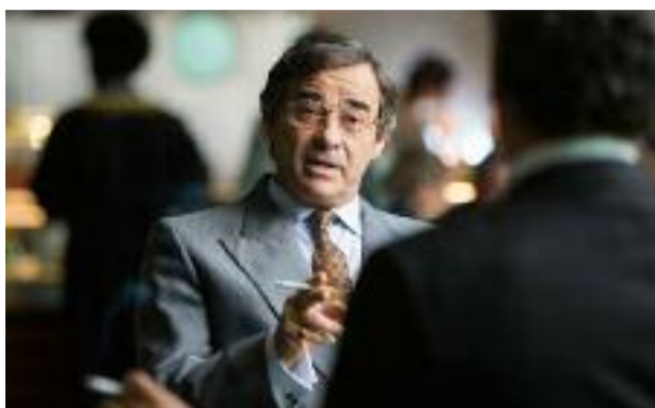
Il a pris cher, De Niro...

Contrairement à Fantômas, Paco Paesa n'a nul besoin de revêtir de masque ni d'user de violence pour effectuer ses coups tordus. C'est par la parole et l'apparence, en douceur, qu'il arrive à ses fins, laissant croire à son interlocuteur ce qu'il a envie de croire. En cela, L'Homme aux mille visages rappelle la grande époque de la comédie italienne, dans sa manière notamment de ridiculiser, voire d'infantiliser les puissants, ravalés au rang de marionnettes dans les mains d'un manipulateur habile. Et de prendre les ambitieux, surtout les corrompus, au piège de leur avidité – c'est "l'arrosé" arrosé, en somme.