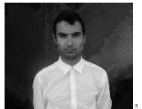
Un pianiste bien frais et sans faux-col

Tigran Hamasyan construit souvent ses disques en opposition aux précédents, comme s'il s'agissait de ne jamais reproduire la même formule et de changer sinon de visage – son style reste néanmoins reconnaissable entre tous –, du moins de masques, qui sont chez lui autant de nuances. Ainsi avait-on eu droit avec Shadow Theater à ce qui ressemblait beaucoup à un album de pop, contribuant à extraire pour de bon Tigran de son image de pianiste jazz et à magnifier ses talents de mixeur de genres : musique classique, contemporaine, traditionnelle, jazz, rock... Un disque qui reste sans doute à ce jour le plus impressionnant du jeune Arménien. Le suivant Mockroot revenait un peu plus aux basiques : le jazz, la musique arménienne, une expression du piano solo qui n'appartient qu'à lui, mais avec des intrusions rock très tendues, à la fois héritières du métal, mais aussi des expressions folkloriques du Caucase. Puis Tigran avait reculé de quelques siècles pour se produire dans des églises avec un chœur de chambre afin d'interpréter de la musique religieuse arménienne du V e siècle (ce qui donna l'album Luys i Luso ).