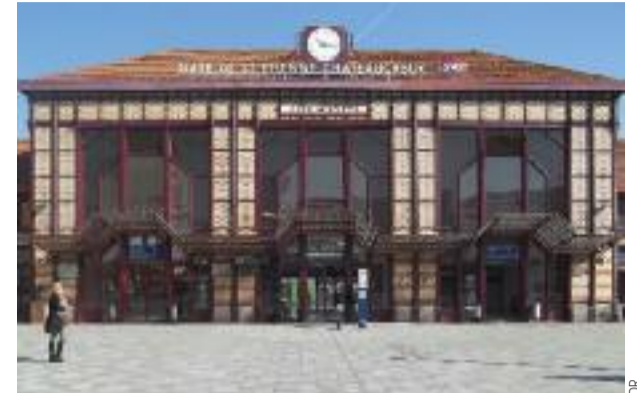
À vue de nez, il est 10h15

Tentez d'aller de Perrache à Firminy (Le Corbusier ! C'est classé à l'UNESCO depuis cet été), et vous allez vous arrêter dans pas moins de... quatre gares à Saint-Étienne ! Chateaucieux, Carnot, Le Clapier, Bellevue. Et encore, il vous manque La Terrasse, près du stade Geoffroy Guichard. Cette anomalie tient en partie au fait que la ligne Saint-Étienne / Lyon est l'une des premières liaisons ferroviaires de France, avec 20 000 voyageurs par jour. Entièrement réhabilitée en 2005, la gare de Chateaucieux est aussi la seule qui accueille des TGV en cité stéphanoise. Connectée au tramway T2 et T3, cette gare a précisément été créée parce que Saint-Étienne ne disposait pas de gare principale, mais de plusieurs petites devenues vétustes au fil des ans. Il fallait combiner à la fois une gare pour les voyageurs, les marchandises et un dépôt pour les machines. Nous sommes alors en 1857. Victime d'un affaissement du sol (elle est construite au lieu-dit "château creux"), elle sera