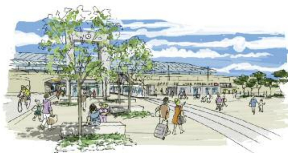
Perrache, après son passage chez le dermato

La place des Archives deviendra complètement piétonne d'ici 2019, les voitures étant dérou-