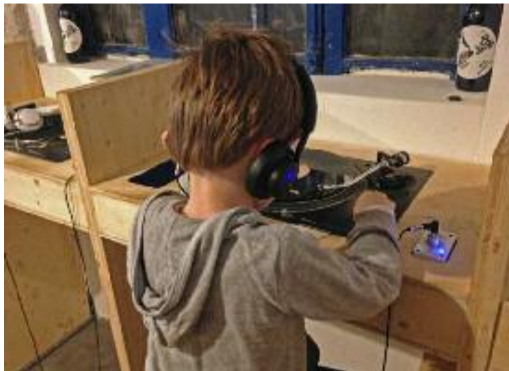
On touche avec les yeux, jeune hooligan !

38 rue Sergent Blandan, Lyon 1 er / Tél. 04 72 46 39 11 Ouvert du mardi au samedi de 12h à 20h30