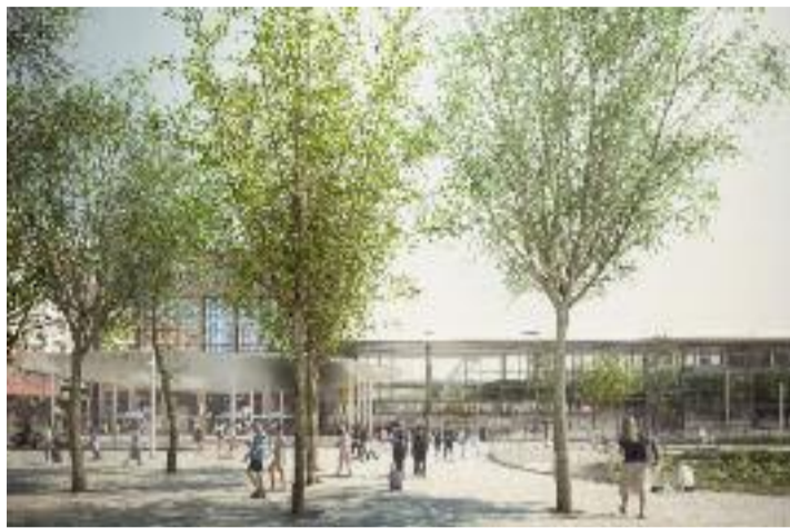
La Part-Dieu, destination préférée des bûcherons et du garde-champêtre

En octobre 1983, la gare de la Part-Dieu devient donc la pièce maîtresse d'un quartier exclusivement pensé pour la voiture, à un point tel que les déambulations piétonnes sont réalisées à un niveau R+1. Pas d'entrée en rez-de-chaussée des bâtiments administratifs mais des passerelles toujours en usage. Pensée dans l'urgence d'une révolution ferroviaire mal anticipée, la gare de la Part-Dieu déborde depuis plusieurs années et va s'agrandir, puisqu'elle est bel et bien le pivot moteur de ce quartier d'affaire, le second plus important en France après la Défense, pourtant bien éloigné des quatre principales gares parisiennes.