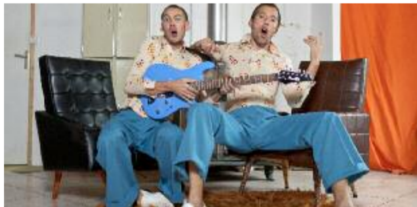
Avec le son, c'est encore mieux

Oui. D'être le plus en lien possible avec ce que l'on peut faire sur les concerts du soir. Cela a plus de sens : le pluridisciplinaire, les gens peuvent le trouver ailleurs, il y a beaucoup de centres culturels et de théâtres. Parmi les personnes qui viennent voir des concerts chez nous, beaucoup ont des enfants, parfois dans différentes tranches d'âges. C'est intéressant de leur proposer