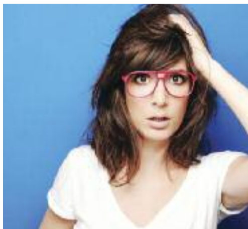
« Je vais quand même pas leur raconter ça ! »

sonnalité, elle n'en est pas moins authentique. Dans le monde ultrapolitisé de l'humour actuel, où les codes sont dictés par une campagne présidentielle hors-norme, le spectacle de Nora Hamzawi est une respiration bienvenue. Sans tomber dans les clichés des spectacles girly qui peuvent parfois sonner creux, la Cannoise de naissance propose un one-woman-show simple et qui s'adresse à tous. Aux jeunes adultes, évidemment, aux jeunes, tout court, aux anxieux comme elle, et à ceux qui s'en moquent. Voilà l'histoire simple d'une