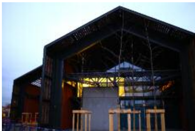
Les murs, c'est bien. Une façade, c'est encore mieux.

De part et d'autre, les salles et l'école de la Comédie qui depuis 1982 est l'une des écoles nationales d'art dramatique incontournables (Vincent Dedienne, Laurent Brethome, le collectif X et tant d'autres en sortent), indubitablement tournée vers les écritures contemporaines. Elle disposera désormais de deux pièces