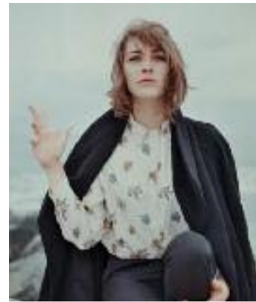
Ouf, j'ai cru qu'elle faisait le signe de Jul !

La critique musicale, ce saucier géant : mettez-y quelques ingrédients du moment et elle vous monte une mayonnaise, un sabayon, une chantilly, faisant du premier ou du dernier venu, sur la foi d'un EP, d'un single, d'une attitude, d'une nostalgie parfois, la next big thing. Cela tient du saut de la foi, pas toujours récompensé, parfois rendu au centuple, mais à la volatilité inévitable, à la longévité incertaine. Depuis une grosse année, on s'entiche donc d'une grande tige poussée dans la grisaille de Charleville-Mézières, patrie de Rimbaud. Une jeune fille aux yeux pers et au port hautain, plume altière et chaînon musical manquant, s'il en fallait un, entre Kas Product et Niagara, Christophe et Catherine Ringer. Le parcours est labellisé sans faute : duo punk DIY bouffant le bitume des Ardennes, bourgeoisement d'un projet solo diplômé des Inouïs à Bourges et des Transmusicales 2016. Et cet EP comme oracle d'un couronnement prévu début 2017, date