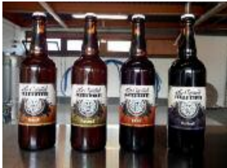
À Lyon, on a les bières. À Saint-É, ils ont les verres

leurs valeurs » : un projet à taille humaine, créateur de liens. Via la bière, donc. La Canute ne propose pas une gamme pléthorique, mais chaque cuvée a son caractère propre. Elle produit deux blondes : l'une de type belge (la Confluence), une autre américaine (la Tête d'Or). Cette dernière est agréablement fruitée (orange, pamplemousse) et légèrement amère – parfaite pour ces premières journées ensoleillées. La X-Rousse est une ambrée, un peu plus houblonnée, enfin, la Vieux Lyon, une « bière noire », ancienne spécialité lyonnaise, avec de fortes notes de torréfaction (café, cacao). Il faut guetter les séries limitées, comme la Subterranean, vieillie sur copeaux de chêne, ou la Lumières de la ville, une rouge de Noël. Et, surtout, aller découvrir tout ça ce week-end, sur leur stand du Lyon Bière Festival !