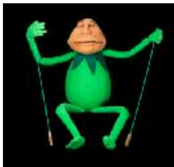
Sacrés Français !

Et après tout, pourquoi pas ? Cesser un temps (pour des raisons de restrictions budgétaires certainement) le rythme effréné des expositions temporaires, de la course au nombre record de visiteurs. Revenir aux fondamentaux, loin de l'événementiel. Le musée Gadagne ouvre en ce début avril trois de ses six salles consacrées à la marionnette. Depuis 1950, outre sa fonction d'être un lieu d'histoire de la ville, ce somptueux bâtiment Renaissance héberge plus de 2000 marionnettes, costumes, décors.... Musée international de la marionnette, musée des marionnettes du monde, c'est désormais un musée des arts de la marionnette. Derrière ce changement de nom, il y a une idée claire : la marionnette vit. Et tant pis pour le paradoxe qui consiste à l'enfermer dans un musée. Elle sort désormais des cages de verre qui l'enferment encore jusqu'en avril 2019 dans les autres parties