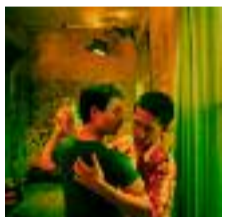
(3) Happy Together