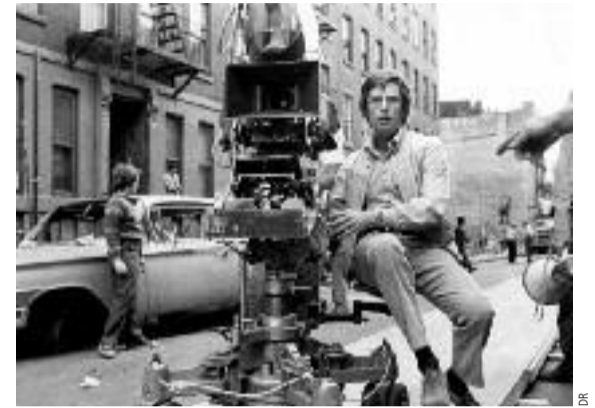
Friedkin, avant de crier : « Moteur ! »

Hardi et sans a priori , le jeune Friedkin habite l'air du temps ; la Fox flaire en lui le candidat idéal pour un polar dans le milieu des stupés, French Connection (1971). Le studio a le nez creux : le trentenaire rebat les cartes d'une poursuite-prédation – pourtant bien brassées par Yates dans Bullitt trois ans plus tôt –, change Gene Hackman en star et s'adjudge 5 Oscar, dont meilleurs film et réalisateur. La Warner le débâche aussitôt pour transposer un roman horrifique à haut potentiel de William Peter Blatty. Entre intuitions géniales, distribution insolite, plans chocs, et B.O. flippante, L'Exorciste (1973) s'impose comme une nouvelle référence