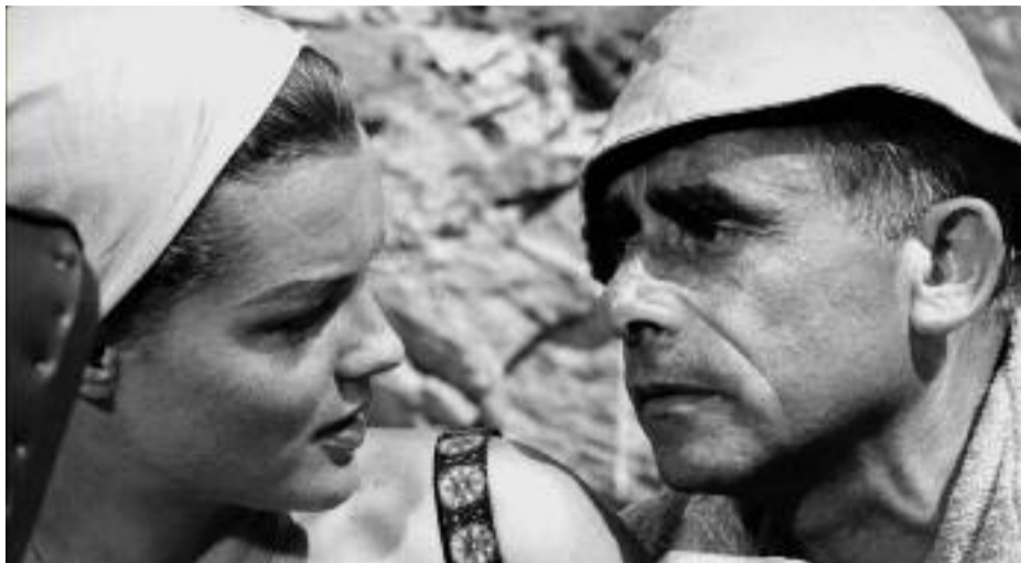
Clouzot et Romy Schneider, sur le plateau de L'Enfer

QUARANTE ANS APRÈS SA DISPARITION, L'AURA D'HENRI-GEORGES CLOUZOT (1907-1977) DEMEURE INTACTE. ET SON ŒUVRE N'EN A PAS FINI D'EXERCER SUR LE PUBLIC ET SES CONFRÈRES SON MAGNÉTISME... DIABOLIQUE.