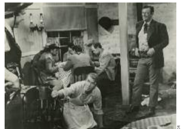
L'Homme qui tua Liberty Valance de John Ford

Imaginez la joie (et le supplice) pour Bertrand Tavernier à qui la tâche a été confiée de sélectionner au sein du riche corpus hollywoodien un florilège de westerns classiques ! Ce genre étasunien par excellence qui, davantage que le film noir ou la comédie musicale, a su restituer la geste épique de la jeune nation nord-américaine. Son aspiration à la liberté, à travers la conquête des grands espaces, ainsi que ses multiples paradoxes, dans ses guerres contre les peuples premiers. Tournées entre 1943 et 1962 par les maîtres du western, les quatorze œuvres retenues brossent du pays un portrait volontiers humaniste et progressiste : elles dénoncent la peine de mort ( L'Étrange incident de Wellman), portent un regard positif sur les Amérindiens ou épousent leur cause ( La Flèche brisée , La Porte du diable de Mann), voire montrent qu'un héros peut à lui seul triompher du mal et de la lâcheté ambiante ( Le Train sifflera trois fois de Zinnemann, Shane de Stevens,