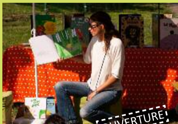
Le Jour du Livre

Organisé par l'Espace Pandora depuis 1996, Parole Ambulante est un festival de littérature contemporaine qui crée des passerelles avec les autres disciplines artistiques (musique, cinéma, arts plastiques...). Pendant 8 jours, écrivains et artistes (musiciens, sculpteurs, réalisateurs...) se rencontreront pour proposer des performances uniques et inédites autour de l'écrit et du voyage.