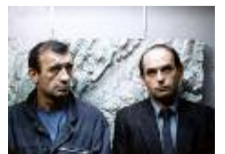
(5) Jean-François Stévenin (à droite), acteur et cinéaste

Les films indiqués en gras sont projetés dans le cadre du festival