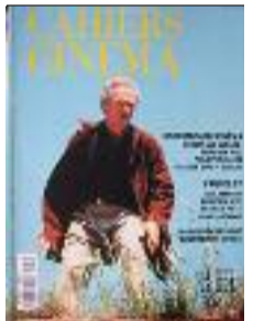
(2) in Les Cahiers du Cinéma n°513, p.76.