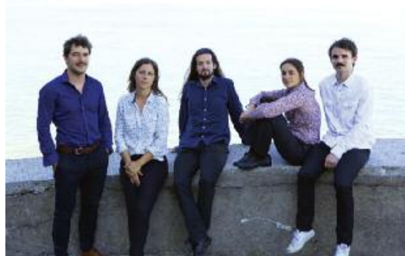
Ah, voilà : des chemises en Dediene

Si Aquaserge plaque ainsi l'un sur l'autre histoire et présent, c'est pour mieux les faire danser