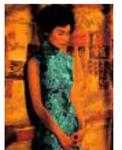
(4) In the Mood for Love