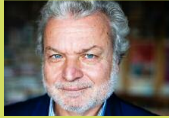
Nedim Gürsel

En présence des partenaires de l'association. Avec le soutien de la Fondation Vinci.