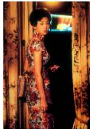
(1) D'humeur amoureuse pour la clôture ?

Le Festival Lumière 2017 se déroule dans 60 lieux et 24 communes. Il y aura 400 séances pour 180 films projetés dans 36 salles et une prolongation fin octobre à l'Institut Lumière avec un florilège de la programmation. Le tarif est de 6€ à chaque séance (hors séances spéciale) mais vous pouvez bénéficier d'un tarif réduit à 5€ en prenant une accréditation à 17€ (14€ en formule Duo et désormais gratuite pour les moins de 25 ans). En plus de vous offrir le catalogue du Festival, elle vous ouvre à de nombreux avantages auprès de ses partenaires.