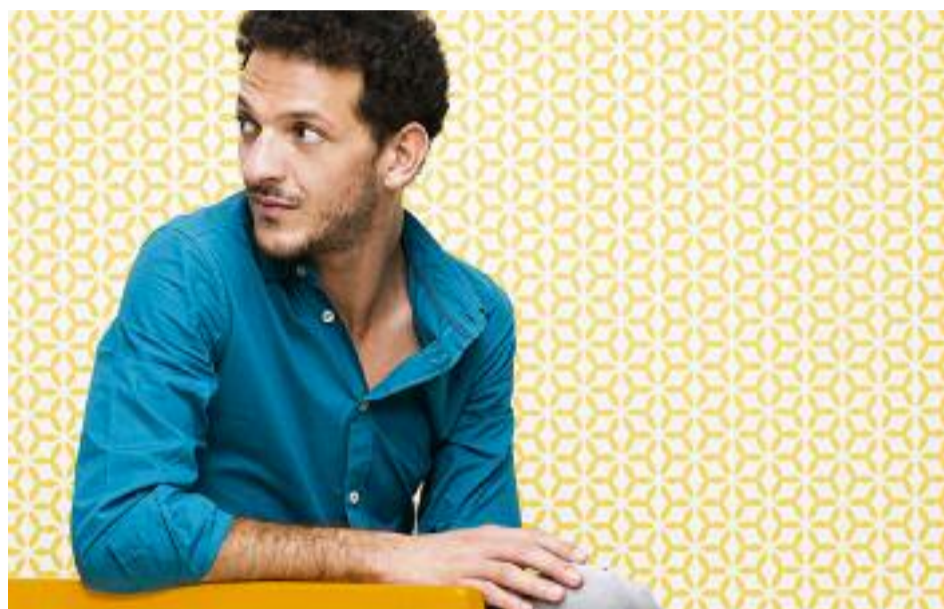
Bientôt, ce motif de fond servira dans l'industrie textile

D'où vient ce titre étrange, S'il se passe quelque chose... ?