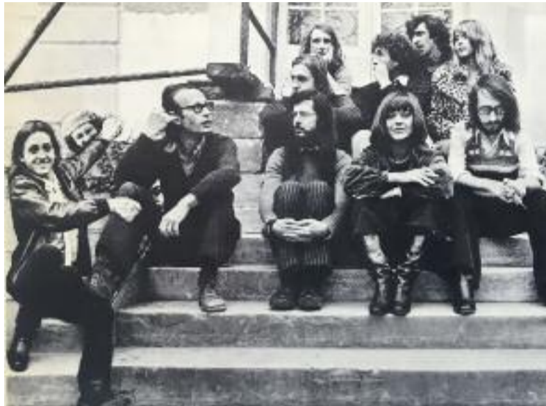
L'équipe d'Actuel

De l'underground des 70's aux coups de fric des années 80 (le premier article sur Tapie, c'est dans Actuel ), en passant par le Grand Mix des DJs de Nova, sans oublier l'écologie (René Dumont, premier candidat écologiste à une Présidentielle en 1974, a été largement soutenu par cette bande, bien seule à l'époque) : ça a infusé. Dix ans après sa mort des suites d'un cancer (le 8 septembre 2007), après toute une vie passée sans dormir dans les effluves permanentes de Dunhill Menthol, "le Grand" est le centre de gravité de deux nouveaux ouvrages. Une biographie signée