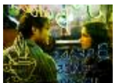
(5) My Blueberry Nights