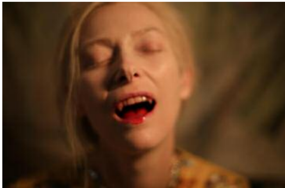
Tilda Swinton, vampire chez Jarmusch