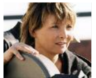
(2) Diane Kurys, en master class à domicile