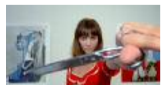
(3) Anna Karina, fine lame du cinéma