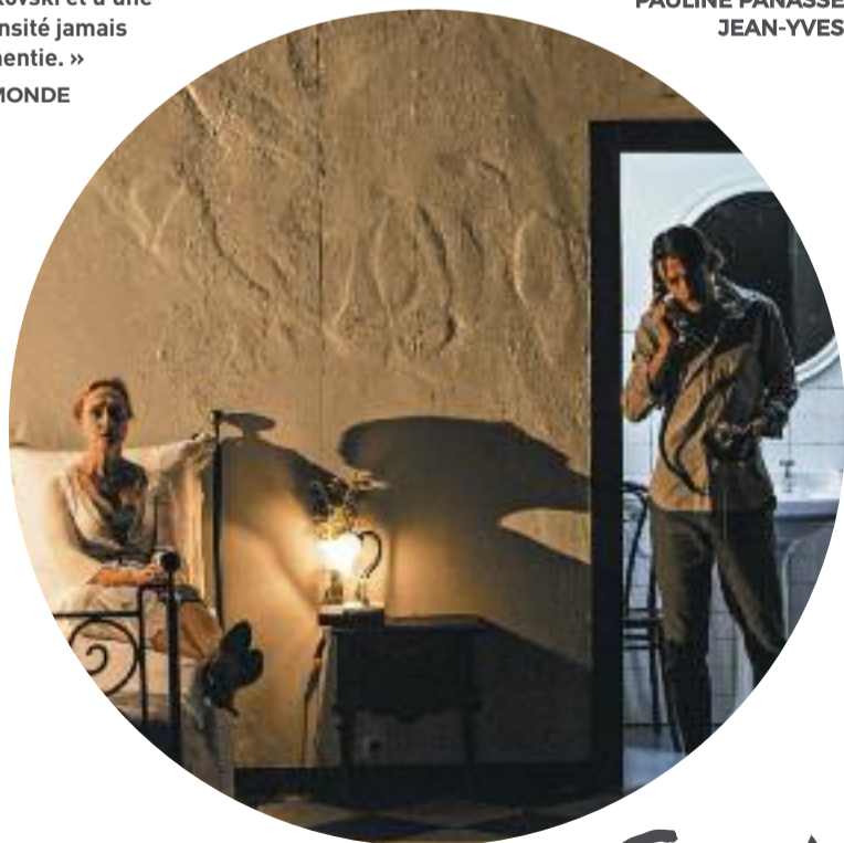
CORRIDA - Licences : 1098274 / 1098275 / 1098276