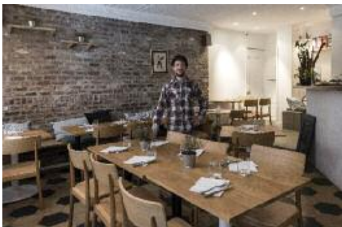
Solution : ce ne sont pas les mêmes photographies