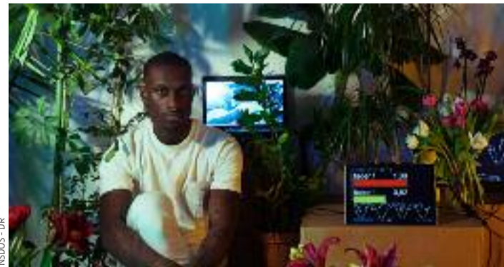
Kirikoo n'est pas souriant, mais il a beaucoup de talent