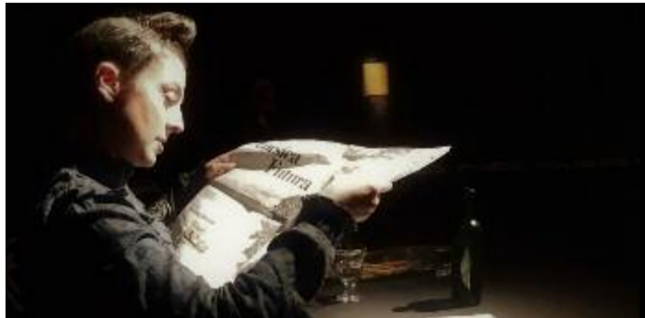
Une "réalisation de soi" proclamée dans les journaux et recrachée en plein repas

Il faut arpenter Vienne, s'extirper d'un centre bien sage pour aller grimper sur la colline viticole du Grinzing. Et tenter de trouver la tombe de Thomas Bernhard. Car si Google Map la localise immédiatement, dans ce petit cimetière, il n'y a aucune indication, alors que sont listées les figures nationales (inconnues des Européens) reposant ici. Vertige. Le plus célèbre des Autrichiens est planqué. La nation n'est pas reconnaissante. Et pour cause : le dramaturge décédé en 1989 n'a pas épargné ses compatriotes, tant la sphère privée que publique. Déjeuner chez Wittgenstein (1984) ne fait pas exception à cette règle. C'est même un sommet du genre. Deux sœurs attendent le retour de leur frère interné à l'hôpital. Si l'une se moque de le retrouver, feuilletant à bout de nerfs le journal où figure cette étrange injonction à la « réalisation de soi », l'autre a tout fait pour le sortir de là et recréer cette famille en deuil de parents récemment disparus. Bien sûr, il n'y aura pas de récompense à ce dévouement qui ne dit rien d'un supposé amour filial mais tout d'individus en charpie se débattant comme ils peuvent avec leurs névroses.