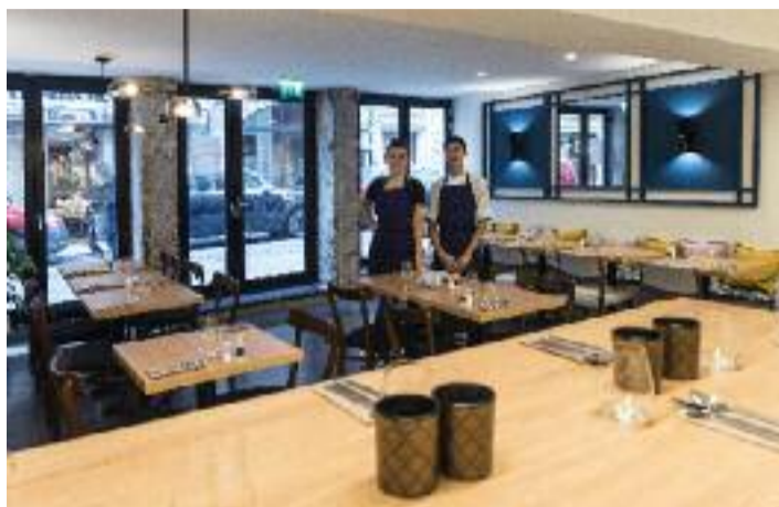
Selon vous, quelle différence y a-t-il entre les images ci-dessus et ci-dessous ?

Lors de notre venue, elle s'ouvrait par un tout doux velouté de potimarron rôti, garni de chorizo. On enchaînait avec un suprême de poulet cuit très (trop) tendrement à basse température, accompagné de nouilles de sarrasin roulées dans le jus de volaille, et de feuilles de chou de Chine sautées. Enfin un dessert simple et réussi : une compotée de pomme, servie froide, sucrée au miel, rendue adorable par une quenelle de ricotta montée (19€). Le soir, on pioche à la carte de jolies assiettes (céramique La Redoute) à partager (ou pas) : houmous ; gravlax de saumon, granny et menthe ; tentacule de poulpe rôti, patate siphonnée ; œuf parfait poireau et noisette... À accompagner, par exemple, d'une bouteille de Pic Saint-Loup bio du Mas Foulaquier (31€).