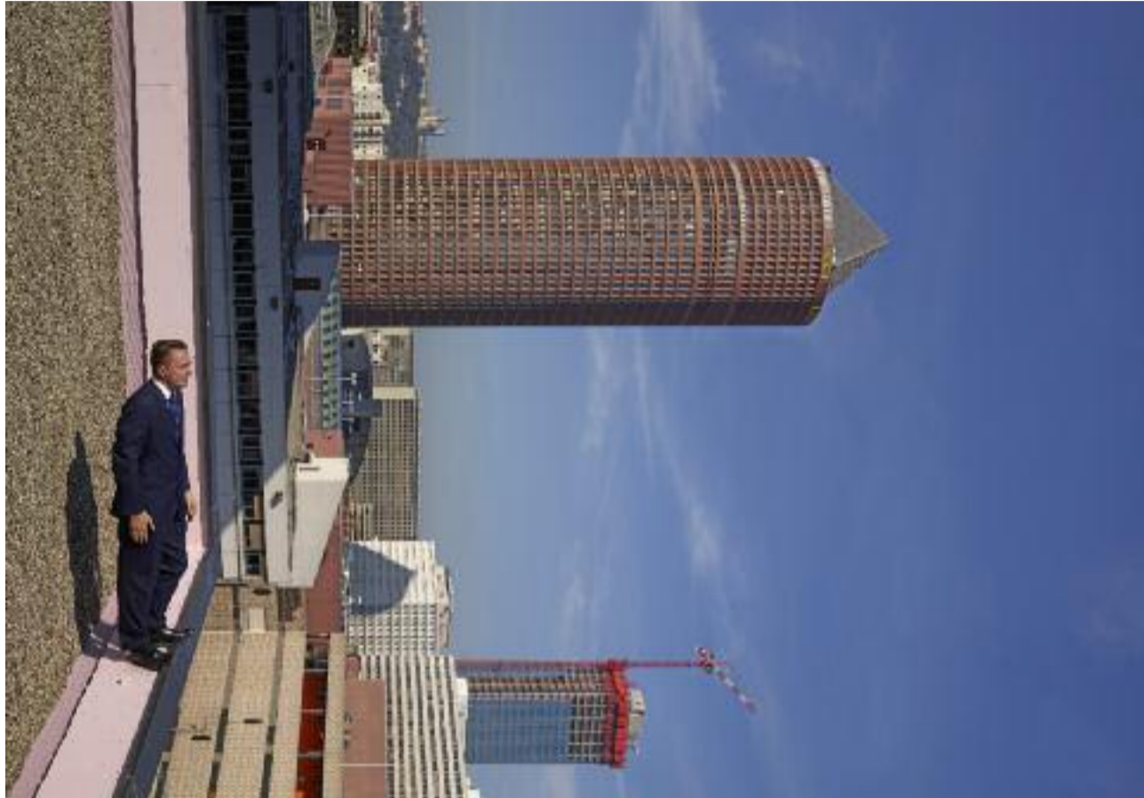
Longtemps face à la gare de la Part Dieu en 45X26 m (!) cette photo de Philippe Ramette a accompagné la mutation de ce quartier d'affaire.

À chaque partie : comptendu de ces séances de psychanalyse en son et en vidéo avec schémas dessinés dans les nerfs de ce corps et, sur les murs en face, des analyses plus classiques mais toujours passionnantes de l'évolution de cette ville et la manière dont les habitants l'ont modelée. Au commencement donc : sa croissance. Elle est étayée