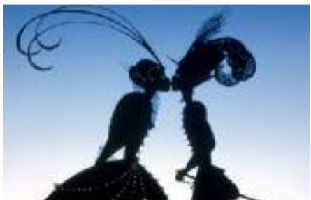
Va souffler 18 bougies la bouche pleine !

Pour partager son enthousiasme, il s'offre un sacré parrain ; un cinéaste dont l'œuvre entière fait vibrer les accents infinis de la francophonie, un magicien des ombres et des lumières : Michel Ocelot. Le créateur de Kirikou (lequel fêtera en fin d'année ses vingt ans) sacrifiera en ouverture à l'exercice de la Carte Blanche en présentant un assortiment de courts-métrages faisant la part belle à l'animation : de Paul Grimault à Raoul Servais en passant par Michael Dudok de Witt et Edouard Nazarov c'est un panorama édifiant qu'il a réuni. Bien entendu, le festival sera rythmé par sa compétition (25 films venus du monde entier, répartis en quatre programmes et départagés par les jurys) ainsi que par ses incontournables rendez-vous que sont les séances thématiques.