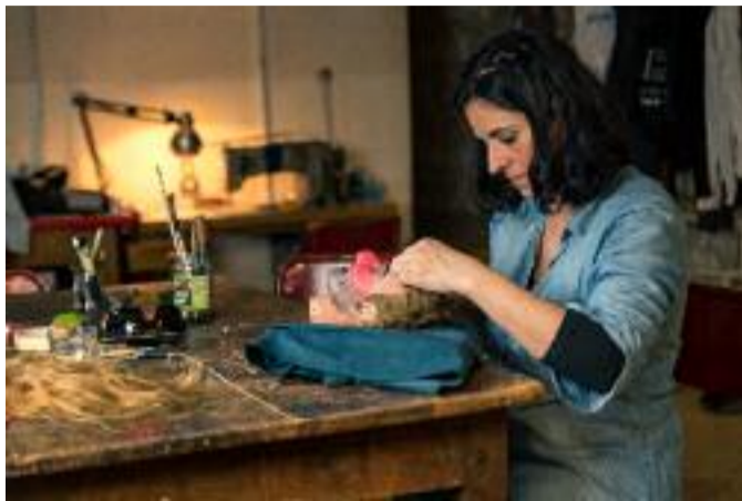
Selon les premières constatations, le patient a de la fièvre

Pap'Allamano en avril, pour petits et grands) et du Guignol pour adultes. Cette déclinaison-ci va se concrétiser par leurs créations, des soirées de politique et satire "Ça tirnole", des soirées à thèmes (pour commencer, celle du 3 mars sera consacrée aux rapports homme/femme) et enfin "Rendons vie à nos archives" qui va se co-construire à partir des ressources des Musées Gadagne.