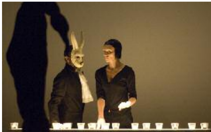
Après treize verres, vous aussi vous verrez des lapins blancs

Fidèle à ses bonnes habitudes, le festival donne à voir de la danse mais aussi fait danser les spectateurs (danse-minute pour s'initier au lindy-hop ou popping, Bal dansant avec Thomas Lebrun) et alterne conférences ("Grand témoin" avec Christian Rizzo), ateliers, workshops