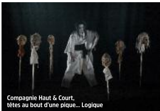
Compagnie Haut & Court, têtes au bout d'une pique... Logique

C'est un théâtre de sensations, onirique et d'une noirceur absolue qui curieusement ne suscite pas vraiment d'émotions sinon celle d'une langueur de plus en plus formalisée. Dans un décor imposant, délimité par une succession de cadres de scène qui dessinent une très grande profondeur de champ, Joris Mathieu et son scénographe Nicolas Boudier déploient leur théâtre optique et jouent des apparitions au lointain comme au devant du plateau. Rien n'est inscrit dans le temps ou l'espace de façon ferme. Un homme vit et disparaît au gré de ses envies depuis des dizaines de siècles. Vorace, il fait de l'Autre sa chose, la possède sexuellement. Il s'agit parfois de sa fille, Amandine Ondylone (quel nom !) dont il fait une "momie". Elle-même trimballe ses enfants, les leurs, poupées de chiffons inanimées. L'inertie dont l'un des personnages se dit "maître" est l'une des lames de fond de ce spectacle et de cette écriture. Sur une échelle de temps immense, les êtres se confrontent indéfiniment à eux-mêmes, semblent être leurs propres proies. Et le constant est le même hors de la sphère intime. Dans les très rares moments qui font sourire, il est, dans Frères sorcières,