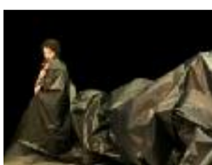
Figure majeure du théâtre actuel, cette jongleuse de formation a l'art de jouer avec les éléments de façon bouleversante. Elle continue à travailler l'élément du vent, comme dans Vortex (son chef d'œuvre). Les Os noirs , créé cet automne à Chambéry, ne faillit pas à sa noirceur annoncée. Jusqu'au 8 mars à 20h ; de 5€ à 18€