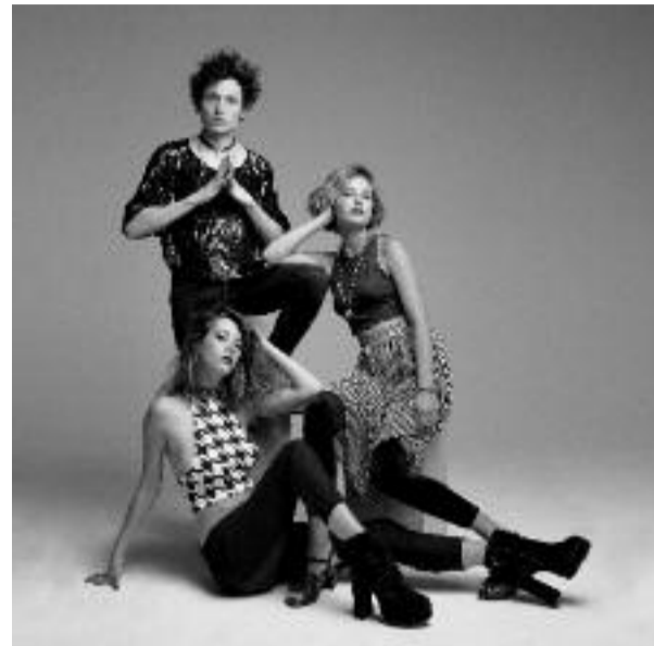
C'est quand ils courent le 100m qu'on rigole

Or, s'il y en a chez qui tout cela ne semble pas être tombé dans l'oreille d'un sourd ou dans l'œil d'un aveugle, et qui fait un bel usage du verbe, c'est bien cet excellent trio (un garçon, deux filles, en partie issus, comme Lapointe, des arts visuels ou de la comédie) de pop synthétique qu'est Paupière qui chante le peintre Kirchner sur des airs à la Niagara, combinant la raideur de la new-wave, la légèreté de l'électro-pop et la sensualité des harmonies vocales (les trois membres du groupe chantent), ce goût pour le sucré-salé venu des années 80 et l'amertume propre à notre époque. Car il n'y aurait que les candides pour prendre ces petits hymnes pop, ces petits hymnes de poche, pour du sucre candeur. Si mièvrerie il y a, elle est de façade et cache un goût certain pour le cynisme, lui aussi bien de son époque désespérée et convo-