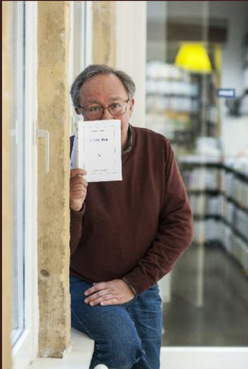
Le grand livre du Moi

Naît alors un style fait de raideur velvétique et détachement à la Talking Heads qui se distingue aussi par le look : « avant les punks on s'habillait déjà avec des épingles à nourrice et des imperméables transparents découpés en chemises et on se faisait traiter d'intellectuels par les babs » explique celui qui, quand tout le monde se coupe les cheveux pour faire comme le Clash, ressort la chemise Lacoste de son père. « J'ai commencé à m'habiller très strict. Ça a donné le look du groupe. Ça correspondait à un trait profond chez Marie et les Garçons : pourquoi choquer les parents ou les bourgeois quand on peut choquer les copains ? C'était beaucoup plus intéressant et ça marchait. La preuve, on se faisait souvent jeter. » Ou presque.