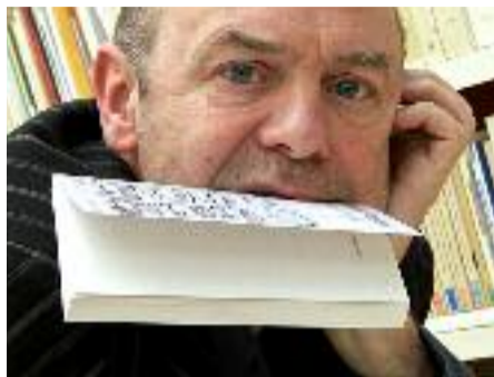
Le comédien Jacques Bonnaffé

Plus de quarante rendez-vous auront lieu dans une trentaine de lieux pour porter avec générosité et oralité la poésie partout. Celle de Rimbaud à l'honneur par l'intermédiaire