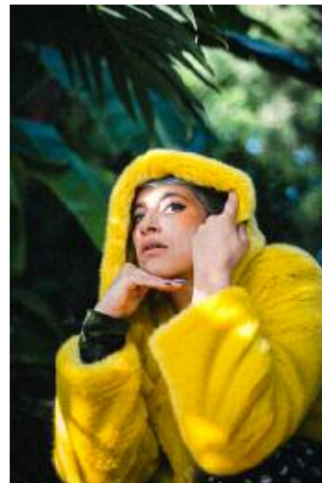
« Cuits, cuits, cuits, les Canaris sont cuits »