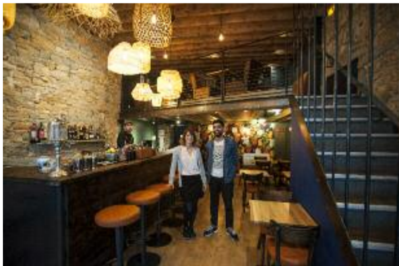
La pose au Sauvage ? Centrale

En la matière, on a déniché Sauvage, un tout nouveau bar à cocktails qui prône cette tendance à travers le cocktail apéritif, installé en lieu et place du tant aimé Gonzo Bar dans lequel on a probablement pris nos premières pistaches. « Notre démarche est simple : prendre le temps de partager, de boire, de goûter à diverses saveurs. Nous souhaitons casser l'image élitiste que certaines personnes peuvent avoir du monde du cocktail, nous avons une volonté d'éducation, nous souhaitons populariser et démocratiser le cocktail