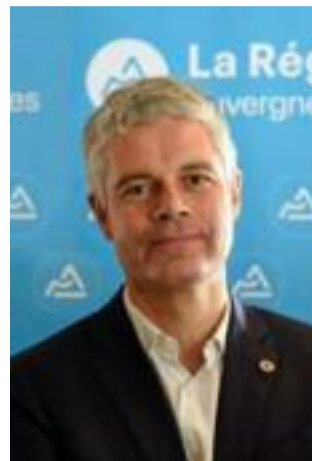
La photographie que Laurent Wauquiez voudrait imposer

de la Région. Les précédents présidents de Région ont eux aussi mis leur photo sur certains supports de com'.