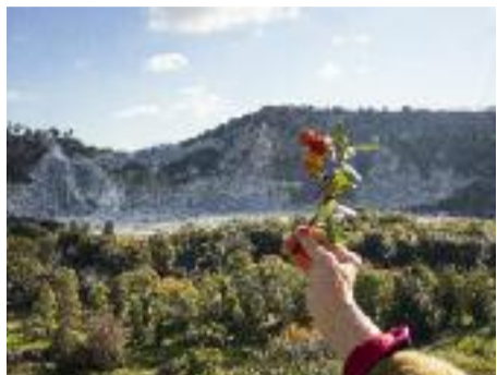
Pas besoin de fleur, on a déjà couché

Libérer la pensée autour de cette mer sacrée avec l'appui du pouvoir authentique des matériaux, de la faune et de la flore, tel est le postulat poétique de The Middle Earth . Chacun des espaces de l'exposition prend racine dans une symbolique du vivant paradoxalement puissant et vulnérable. Aucun monumentalisme n'émane