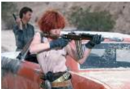
Cherry 2000

T out le monde s'accroche à son voisin, décollage imminent pour Les Intergalactiques ! Le festival de science-fiction se met en orbite autour du thème de la Femme : il sera question de sa place dans la pop culture et de la technologie comme outil d'émancipation. On ne peut évidemment pas parler de SF sans quelques bons films : les rétrospectives du festival sont là pour ça. De Cherry 2000 (1988) de Steve de Jarnatt, film d'action déjanté où le protagoniste part à la recherche des pièces détachées pour réparer l'amour de sa vie, un robot à la perruque rousse flamboyante, au délirant Frankenhooker (1991) du culte réalisateur Frank Henenlotter, où un amoureux un peu dérangé assemble des morceaux de prostituées pour greffer sur ce corps le cerveau de sa bien-aimée, il y en aura pour tous les goûts, surtout extrêmes. Des longs mais aussi des courts-métrages : le festival est l'occasion de participer au concours "48h plus tard", durant lequel les équipes devront réaliser en deux jours une production de SF, toujours contraints par les règles farfelues du jury. Et si vous ne vous sentez pas l'âme d'un cinéaste, il est possible d'assister à la com-