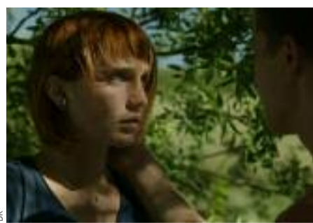
Lune rousse ? Pas bon pour les récoltes, ça...

Le fait que les deux aient encore un pied, voire un pied et demi dans "le plus bel âge" explique sans doute l'acuité du regard, dépourvu de cynisme ou de désabusement. Pas de contrefaçon non plus dans le langage, les comportements, qui participent d'une revendication sociale, temporelle et géographique. À l'intérieur de ce cadre restreint, Luna va suivre une trajectoire "dardennienne" à la fois initiatique et de rédemption, passant de petite "cagole" inconsé-