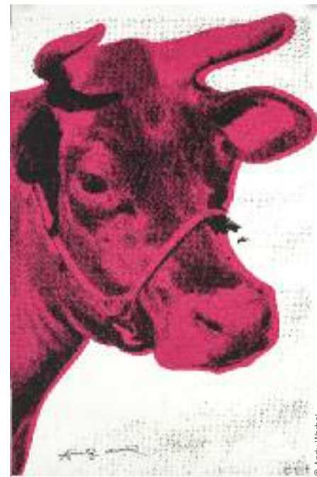
La vache ne rit pas toujours

Notamment le jeudi 12 avril entre 14 et 17h avec Papy@rt, mythique affichiste et activiste croix-russien devant l'éternel, qui convie les pré-ados à découvrir l'art de la sérigraphie, technique d'impression dont Andy Warhol était fan. D'abord, on crée le motif, on l'insole (on l'expose à une source de lumière) et on l'applique sur différents supports papier ou textile. Les jeudi 19 et vendredi 20 avril, les kids pourront imiter le maître grâce à la plasticienne, édi-