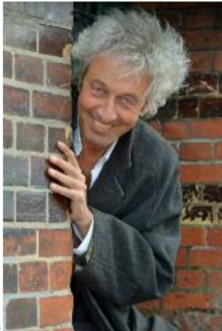
« Vous me reconnaissez ? »

Autre "monstre", Carlo Lucarelli aime aussi explorer l'Histoire. Pour Le Temps des hyènes (Métailié) cet émule de Conan Doyle et Kipling fait infuser dialectes italiens et abyssiniens dans un récit brûlé par le soleil, heurté par la guerre