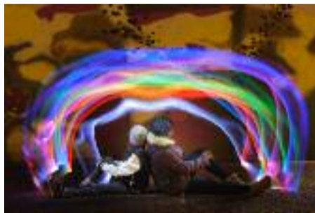
Deux ados, dos à dos

Le mercredi 18 avril, on rentre dans le vif du sujet pendant trois heures. On enfile tenue et