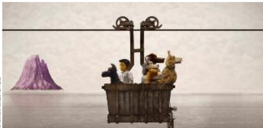
Où est la tête-tête ? Où est la queue-queue ?