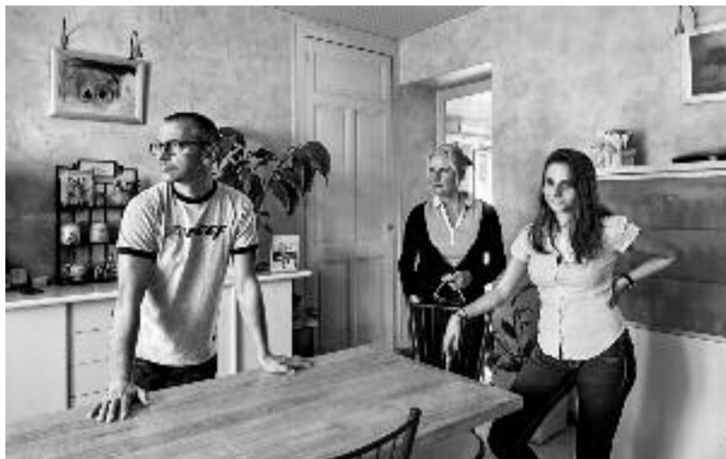
Une famille de la cité Mignot