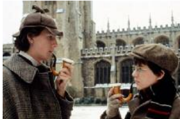
Aucun des deux ne pipe mot

L'occasion pour celui-ci de réviser ses - nos ? - classiques cinématographiques avec Le Secret de la Pyramide de Barry Levinson (À l'Institut Lumière le 7 avril à 14h30). Ou de découvrir les aventures, plus récentes, d'une lapine policière ( Zootopie , au Lumière Fourmi, le 8 avril à 11h) ou d'Agatha, une détective de 10 ans ( Agatha, ma voisine détective , à Écully Cinéma, le 8 avril à 15h). Pour les plus joueurs, le festival proposera un espace jeux à l'Hôtel de Ville, ouvert les samedi et dimanche de 10h à 18h, où l'association Fajira - collectif d'associations du jeu et de l'imaginaire - proposera une sélection de jeux autour de l'enquête et des mystères. L'association Yes we game proposera, elle, un jeu de communication et de bluff baptisé "Une nuit avec les loup garous". À partir de 10 ans, loup garous oblige.