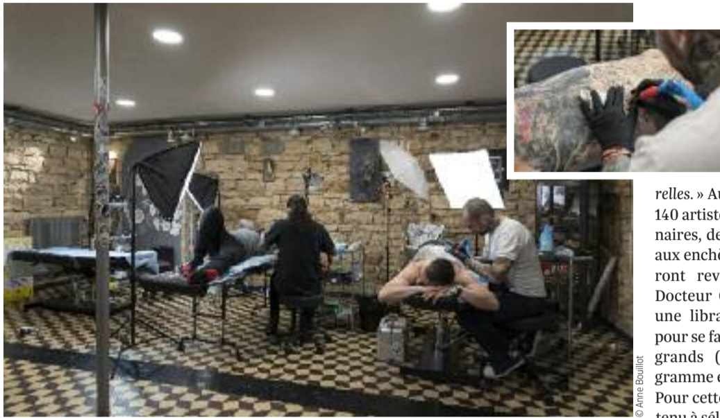
Ça va un peu piquer pendant une seconde ou 3600.

Le premier rendez-vous consiste à discuter du choix du tatouage et de l'endroit où il prendra place – l'as du tattoo déconseille les phalanges, pourtant grande tendance du moment, et plus globalement tous les endroits où « la peau plisse ». Le créatif préfère l'idée à la photo, histoire de « laisser libre court à son imagination ». Il suggère un dessin, sa passion depuis tout petit. « Je prends le temps de discuter avec le client, de regarder les motifs, de voir ce qu'il souhaite réellement. Le tatouage est un véritable art. »