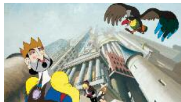
Blanche-Neige a passé une sale nuit

Attention chef d'œuvre inter-générationnel : Le Roi et l'oi-