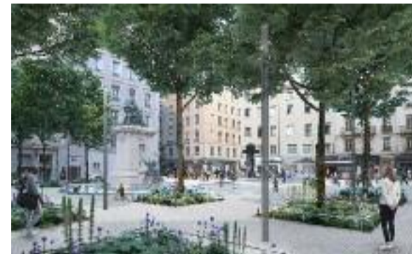
La place Ampère

D epuis la fermeture de l'hôpital en 2010, les élus nous le serinent : « nous allons rendre l'Hôtel-Dieu aux Lyonnais ! » Sauf que les HCL ont toujours été ouverts au public avec ses cours charmantes et certes décaties. Dont acte. Les Hopitaux ne pouvaient pas payer la note des faramineux travaux. Et ils l'ont donc cédé par un bail emphytéotique de 94 ans. Bienvenue désormais à un temple du commerce plus bourgeois que bohème (avec Fragonard, Vatel, Clarins, Buddha Bar, Artisan de la Truffe...) dans les murs historiques d'un haut-lieu de la médecine édifié au XVII e (édifice tel que nous le connaissons, mais dont les fondations remontent au Moyen-Âge) et le dôme de Soufflot, un siècle plus tard. Rabelais y fut médecin, mais tout ça vous ne l'apprendrez pas-là puisque de musée de la médecine il n'y aura plus, faute d'investissements publics. Viendront un grand hôtel et la Cité de la Gastronomie mi-2019. La joie sera