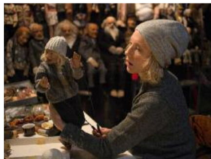
Inception de Cate Blanchett

Manifesto se présente partiellement masqué, avançant un double concept : une mise en images libre de quelques grands écrits théoriques ayant structuré la pensée politique ou artistique humaine ET l'interprétation/déclamation desdits textes par la même comédienne incarnant treize personnages (disons, stéréotypes) différents ; ici Cate Blanchett. Dès lors, il faut dissocier les deux approches. La première visant à mêler la parole péremptoire d'un théoricien à un contexte contemporain trivial est parfois productive, au-delà du décalage systématique et lorsqu'elle ne tombe pas dans