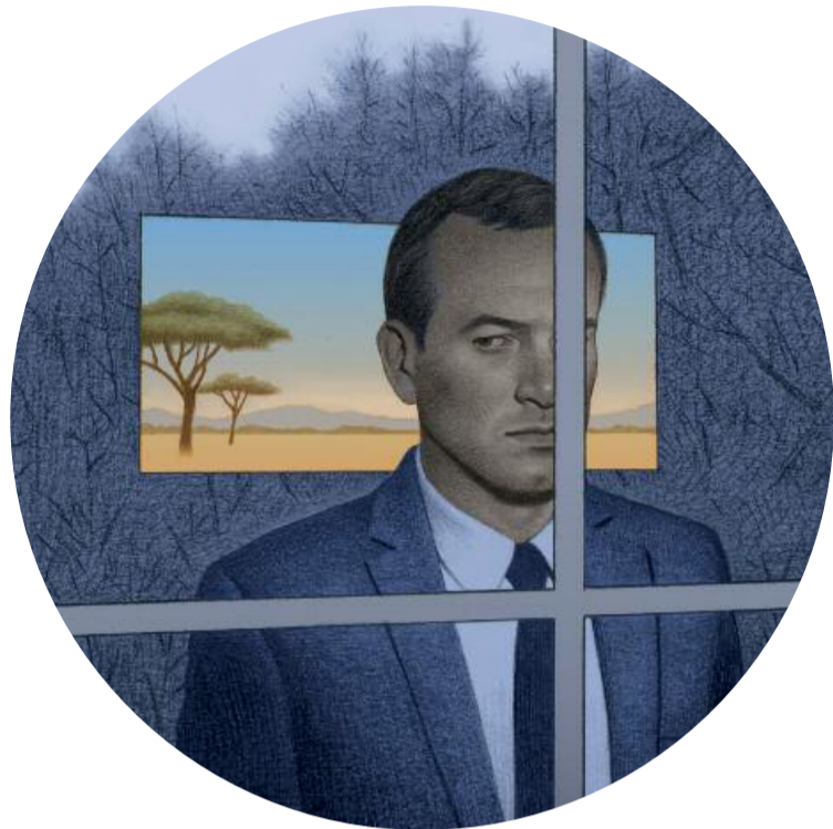
CORRIDA - Illustration : Thomas Ehrtsmann

Cette pièce est magistrale. On a rarement vu une telle excellence, une telle homogénéité. Botala Mindele est remarquable d'intelligence. Dégraissée, percutante et portée par un humour inattendu. L'ÉCHO