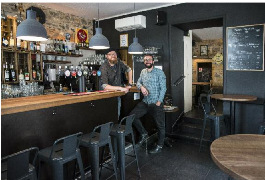
ils sont au poil, on ne va pas les tailler

et d'un Progrès qui traîne sur la table d'à côté. Et là, eh bien au Bar Bu, ça matche : la feuille de chou locale comme L'Équipe sont à dispo dès l'ouverture (11h la semaine, 10h le week-end) et l'on sirote une carte qui ne se la joue à aucun moment. Du basique : le demi à 2,8€ (six bières à la pression, dont deux qui tournent et une consacrée uniquement à de l'artisanale). Du pif (au verre : trois blancs, deux rouges, un rosé), un peu de bio à l'occasion, pas de naturel (ce qui manque un chouïa quand-même). Et les alcools classiques, avec les petits apéros vintage qui vont bien, style Suze, pour