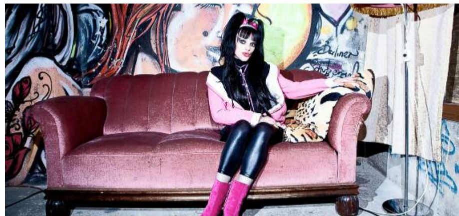
À quand un biopic de Klaus Kinski ?

« L a mère du punk chante Brecht à l'Opéra de Lyon, une première en France ! », nous annonce l'Opéra en claquant son point d'exclamation tel un fouet pour souligner l'extraordinaire de la chose. Tu m'étonnes. Et pourquoi pas « Johnny Rotten reprend Gershwin ! » ? Parce que quel que soit le souvenir qu'on ait de l'icône punk allemande – une sorcière post-apocalyptique qui nous prouve qu'on peut s'essuyer les yeux avec la langue ; son drôle d'African Reggae (son tube porté par un yodel tyrolien malade) ; son cours de masturbation féminine à la télé ; la légende (vraie) selon laquelle elle fut expulsée de sa RDA natale à l'âge de 20 ans pour attitude anti-sociale – il n'y a rien de plus logique. Car la « Mère du punk » est une « enfant de Brecht ». Sa propre mère, à Nina, pas Brecht, actrice et cantatrice célèbre travailla avec le grand Bertolt au Berliner Ensemble dans la première moitié des années