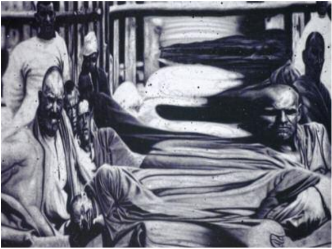
Dedans V

Le corps est humain ou végétal, il est aussi crâne ; un fil conducteur qui délocalise l'être, le vivant. Tout est distendu, on se surprend même à ressentir un certain vertige malgré