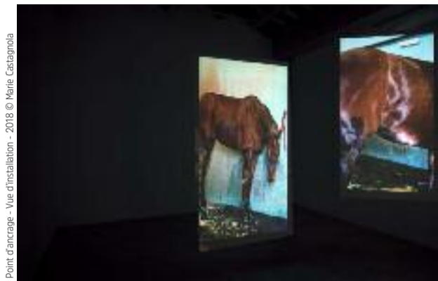
Pour moi, ce sera saignant le burger

Aux Halles du Faubourg Jusqu'au 11 novembre