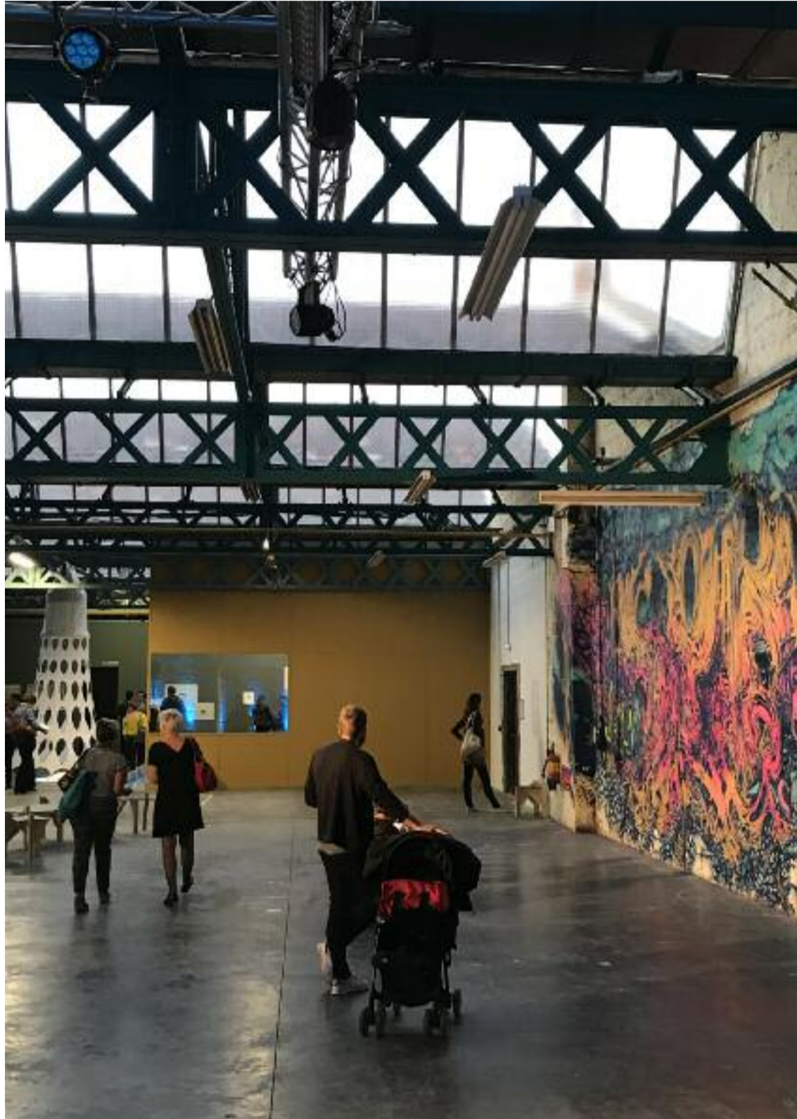
Les Halles du Faubourg : t'imagines la note de chauffage en hiver ?