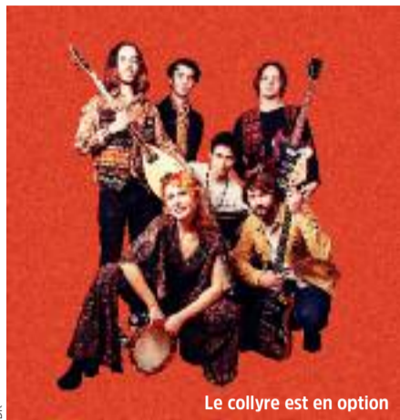
Le collyre est en option

C'est à Nuits Sonores 2018 et lors de la carte blanche à Amsterdam que l'on a pu découvrir à Lyon le groupe Altin Gün. Lequel aurait très bien pu s'intégrer à une carte blanche à Istanbul tant la musique qu'il pratique est proche de l'essence de la pop turque d'une certaine époque.