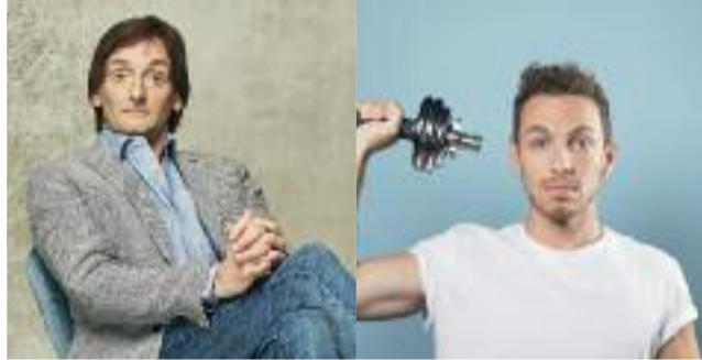
PIERRE PALMADE 23/10/18 - RADIANT