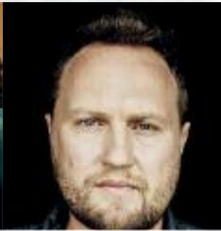
OLDELAF 20/10/18 - BOURSE