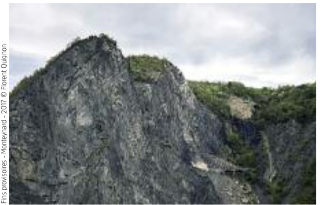
Oui, de loin, on dirait bien un synclinal inversé, vous avez raison