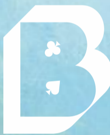
Illustration : Mélissa Faidherbe - Conception graphique : Perliette & BeauFize