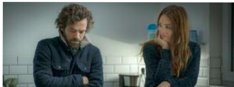
Ongles rongés ? Et si on en parlait avant le César ?

L e mois de janvier ne se résume pas à la litanie des vœux ni aux galettes. Il subit également les assauts d'une gigantesque fièvre rétrospective ; en réalité, l'incubation de l'épidémie saisonnière de palmarès, attendue pour février. Parmi les symptômes habituels figure la semaine des Incontournables, qui remet à l'affiche dans quelques salles du réseau UGC une poignée de longs-métrages marquants, remarquables et/ou issus des filiales de production/distribution dudit exploitant. Dans une période où la chronologie des médias n'en finit plus d'être débattue, et par voie de conséquence la durée de vie d'un film sur les écrans, avoir la possibilité de (re)voir une œuvre cinématographique dans le format et les conditions pour lesquelles elle a été initialement conçue n'a pas de prix. Ou plutôt si, et il est ici réduit : 3, 50€ la place à toutes les