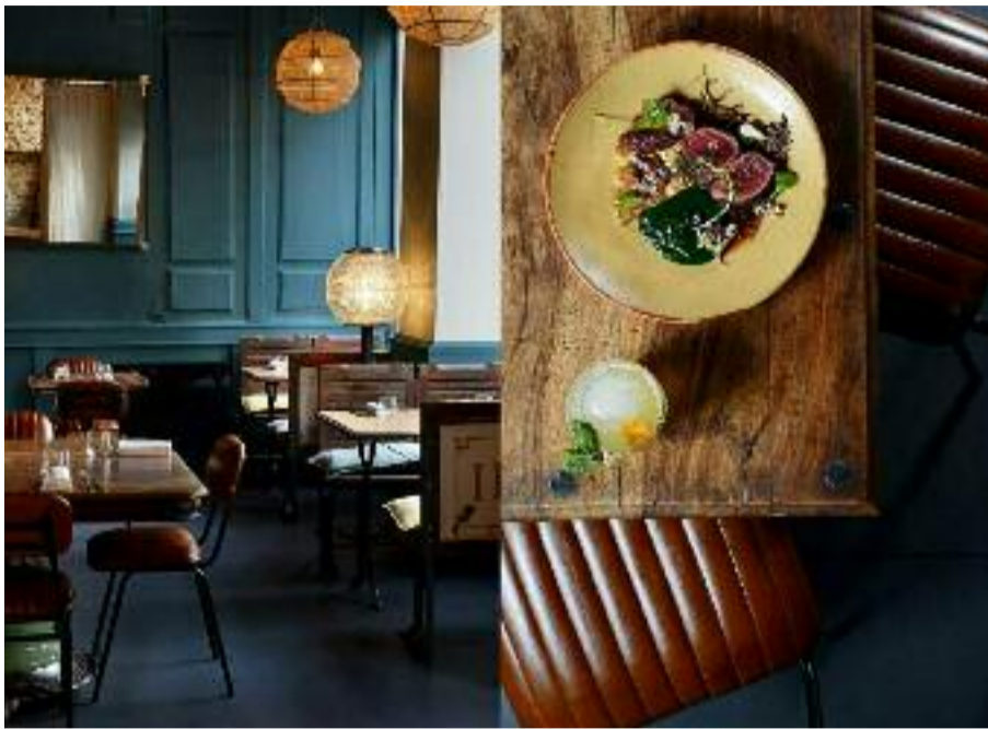
Notre vision de la detox ? Décalée

Le journal Le Monde raconte les derniers instants de Senderens, le 25 juin 2017. Invité chez une amie, il remettait en cause l'association entre les amuse-bouches apéritifs et un Americano. Il préconisait plutôt de boire ce classique avec des olives fourrées au magret de canard. Alors qu'il portait à nouveau son verre à ses lèvres, il succomba. Laissant cette question ouverte : pourquoi ne pas soigner les accords mets et cocktails ? Après tout, on a bien vu ces dernières années des restaurants gastronomiques tenter de nouvelles associations entre leur cuisine et d'autres liquides : jus de fruits et légumes frais, thés rares, voire spiritueux. La rencontre, dans la capitale française, de deux jeunes gens passés par deux établissements phares de la scène cocktail et de la néo-bistronomie va donner naissance au menu