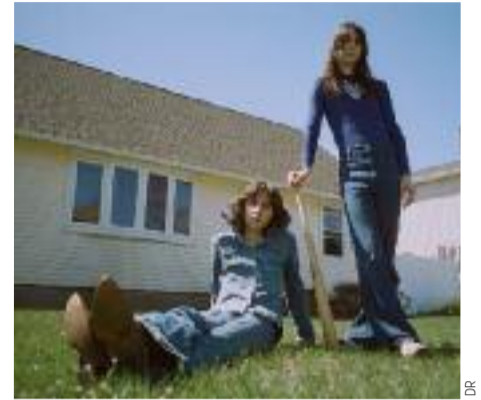
The Lemon Twigs

Ah, cette tarte à la crème qu'est le fameux « album de la maturité » ! Que n'a-t-il été outrageusement convoqué pour un oui ou un non. Reste que concernant Feu ! Chatterton qui l'avait mis, le feu, à tout un pan de la chanson rock française, à coups de titres incendiaires, rien ne s'applique davantage à la qualification