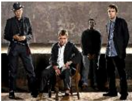
The Good, the Bad and the Queen