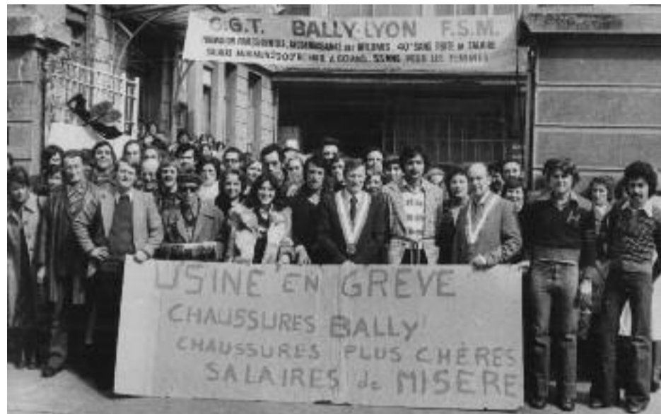
Usine Bally en grève en 1970

S' il est difficile d'imaginer que Lyon décline la même expo sur les engagements ramenés à son périmètre, c'est aussi qu'historiquement, nous rappelle le panneau introductif au Rize, « Villeurbanne est devenue au XVIII e siècle un espace refuge pour les groupes marginalisés, réprimés à Lyon ». La Ville résiste aux assauts d'annexion en 1856, 1857, 1860 et 1874. L'ancienne commune ne cède pas comme la Guillotière, la Croix-Rousse ou Vaise, abandonnant juste le parc de la Tête d'Or. Forte de cette autonomie portée par le député Francis de Pressensé, Villeurbanne se constitue un terreau résistant. Après une séquence explicative (et longue à lire), l'exposition Engagements !? laisse place à un espace immersif circulaire tatoué des mots liberté-égalité-fraternité dans lequel il est possible de rester longtemps, tant il y a à écouter et à voir (des affiches) – on peut même prolonger à domicile avec la lecture de la vingtaine de fiches A4 recto-verso explorant toutes ces luttes.