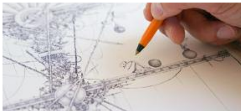
« Vous êtes ici »