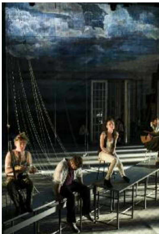
Là, tout n'est qu'ordre et beauté, luxe calme et volupté (Baudelaire)