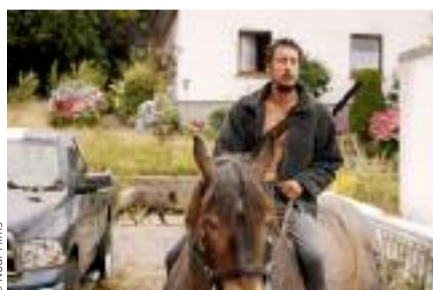
Un véhicule à 1CV fiscal