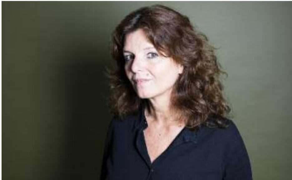
Maylis de Kerangal

À l'Hippodrome de Parilly du 6 au 10 mars