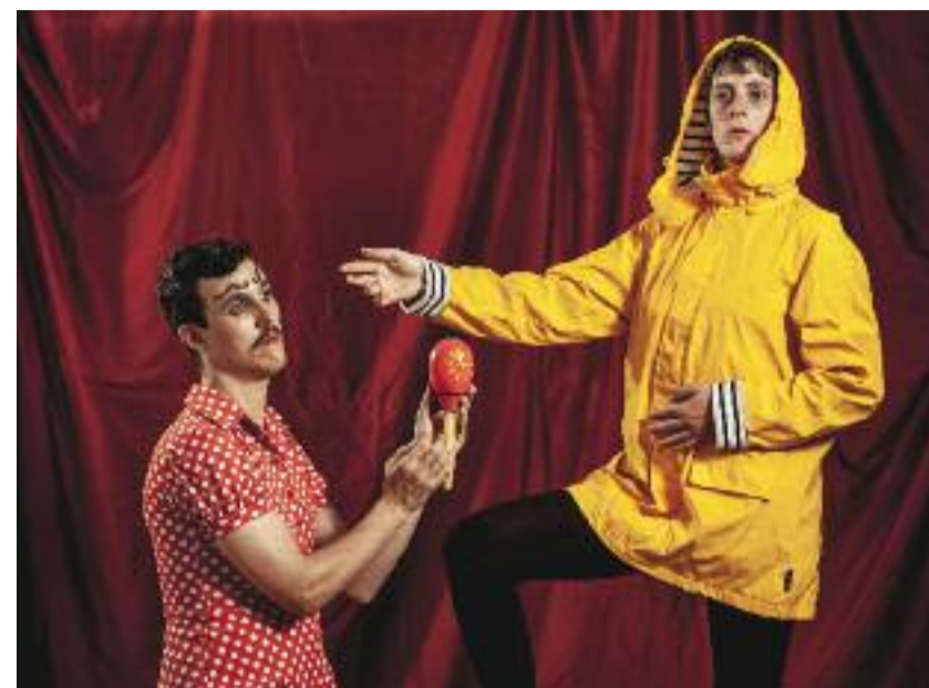
Gillet jaune, collection hiver-printemps 2019 : la version longue est attendue

C'est encore le cas cette année pour ce rendez-vous qui s'étale à partir du 11 janvier sur une quinzaine de jours et convoque, au gré parfois de cartes blanches, mais pas que, une majorité de formations lyonnaises officiant dans des styles allant du rock bruitiste (Rien à Branler, Dénigre, Veni Vino Vici) au garage (Mascaro) en passant par la chanson chtarbée (Ursule et Madame, Brice et sa Pute), le folk électro (Yack) ou