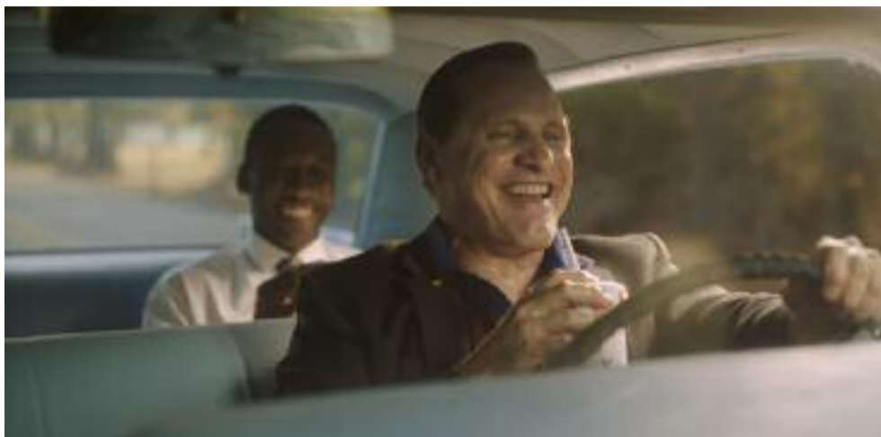
Ils viennent de voir les résultats des Golden Globes

Restons dans le trouble pour Grâce à Dieu , évocation d'affaires de pédophilie ayant touché l'épiscopat lyonnais (des affaires judiciaires sont en cours), où François Ozon dirige Melvil Poupaud, Denis Ménochet et Swann Arlaud (20 février). Longtemps annoncé avec Jessica Chastain, Ma vie avec John F. Donovan , le film "hollywoodien" de Xavier Dolan sortira le 13 mars avec Kit Harington, Jacob Tremblay et Kathy Bates. Il sera au moins