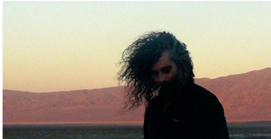
Longs, cheveux, longs !

Impossible aujourd'hui d'affirmer qu'au sein du totémique festival lyonnais les nuits sont plus belles que les jours – cela nous conduirait dans des débats sans fin entre spectateurs diurnes et aficionados nocturnes. Une chose est sûre pourtant, c'est que la Nuit 2, celle que Nuits Sonores consacre à son traditionnel Circuit, se démarque de l'ordinaire du festival. Particulièrement depuis qu'a été abandonné le qualificatif "électronique" qui l'accompagnait depuis l'origine. Cette respiration esthétique, rythmique, temporelle et spatiale au cœur de Nuits Sonores se vit ainsi moins comme une balade ou une déambulation qu'une cavalcade en treize étapes à travers les esthétiques musicales actuelles et les lieux phares qui les portent sur l'ensemble du territoire lyonnais (Ninkasi, Transbordeur, Périscope, Sonic, Groom, Marché Gare, Opéra Underground et on en passe). Impossible bien sûr, à moins d'être doté du don d'ubiquité – ce que l'accélération de notre société et des technologies ne permet pas encore tout à fait – d'être partout à la fois et d'assister à l'ensemble des propositions indécentes offertes par cette nuit folle. Il convient, mais cela le festivalier en a l'habitude, de choisir et donc de renoncer. Ce qui sera difficile, puisque, outre nombre de DJ