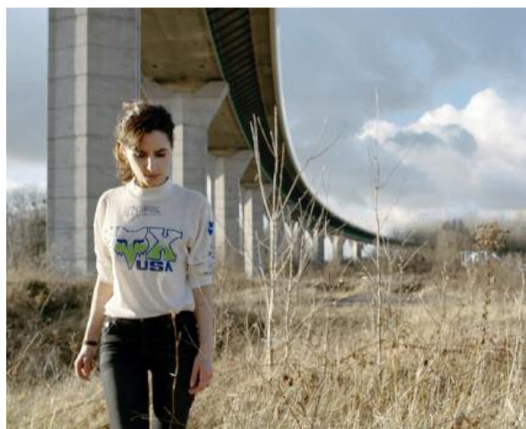
Elle finira bien par retrouver son aiguille