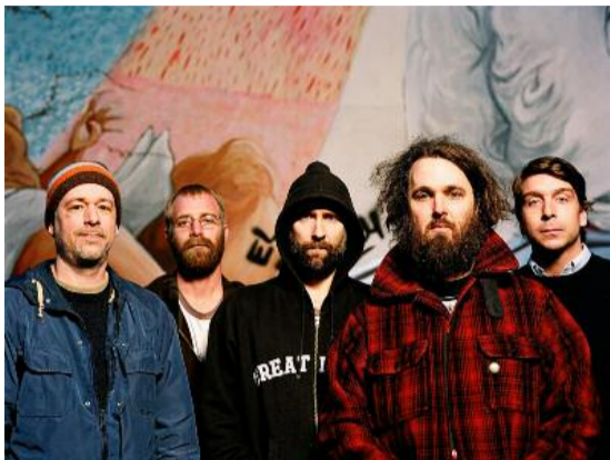
Du coup, ils ont l'air en berne...

Une série d'albums en attestent, comme le tortueux Perfect from Now , troisième essai se démarquant des deux premiers par sa complexité. Mais aussi et surtout son successeur, comme revenu aux bases initiales au moment même où la grâce frappait dans le mille. Keep it like a Secret , dont le titre proverbial semble encapsuler l'essence même de Built to Spill pour mieux la répandre, est l'un de ces albums