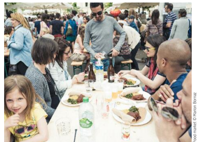
Un prétexte pour manger végétarien en buvant de l'eau