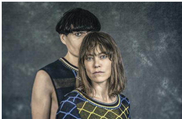
Avec un peu de bol, il reste des places

Mais c'est là encore sur scène que la proposition prend toute son ampleur : de ces expérimentations (le duo utilise des tubes d'acier,