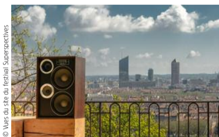
© Vues du site du festival Superspectives

Ambitieux, varié, ouvert, Superspectives se déroulera sur pas moins de quatre semaines (à raison de quatre concerts par semaine), en plein air, au sein du très beau site de la Maison de Lorette sur la colline de Fourvière. Frederic