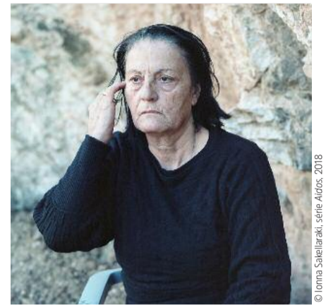
Ne bougons plus

M élancolie suspendue. Le coude en l'air marque un geste lent, la femme regarde hors champ de ses yeux d'une intense fixité au milieu d'un visage, plissé comme la roche qui fait fond. Le temps s'est comme alourdi, recouvrant d'une poussière invisible les pierres, les visages, les troncs entortillés de deux arbustes. Un drame mutique imprègne les huit images de l'artiste grecque Ionna Sakellaraki exposées sur une même cimaise. Le portrait central saisit immédiatement le spectateur, et les images autour pourraient être des lieux familiers à la femme photographiée (une chambre ouvrant sur un jardin, un seuil enneigé et baigné de lumière rouge sang et jaune), ou des souvenirs, ou encore des éclats de rêve (une nature morte de poisson, un cheval lourd et sombre faisant face à un mur décrépi...). La série se nomme Aidos, déesse de l'humilité et de la modestie. Dans une grande économie visuelle (aucun signe ou symbole superflus), la photographe compose un puissant agencement d'affects et de perceptions.