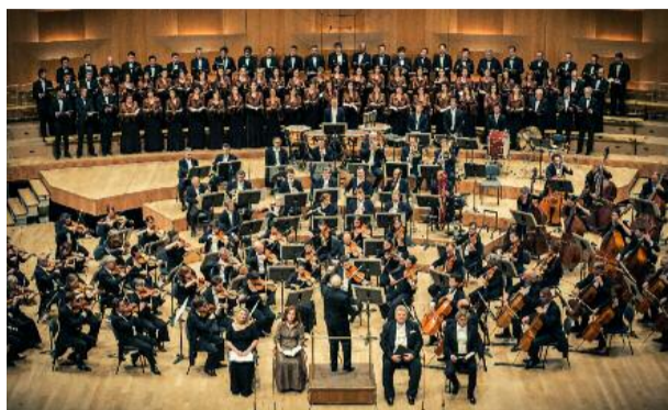
J'en vois deux au fond qui font les pupitres