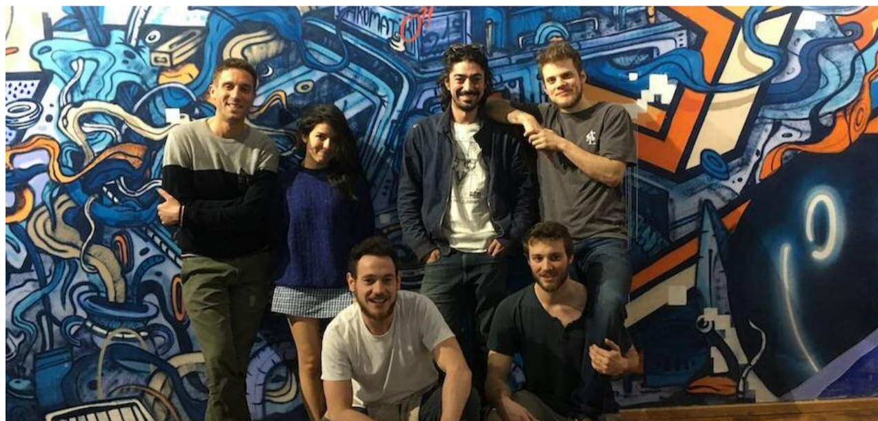
Leur tête quand ils ont découvert que la fresque n'était pas sèche...

Chez Chromatique, on cultive la diversité. À l'origine du projet : six Lyonnais, issus de parcours variés : École des Arts et Métiers de Cluny pour les uns, école de commerce ou encore master audiovisuel pour les autres. Regroupés en un collectif, Bitume, les jeunes gens se sont lancés dans la scénographie et l'habillage de lieux pour des festivals et entreprises, tout en organisant ponctuellement leurs propres événements. Le dernier en date, Rehab, organisé à Paris en 2017, célébrait les arts urbains, dont Bitume a fait sa marque de fabrique : un bâtiment de 3000 m 2 sur le point d'être réhabilité, une centaine d'artistes graffeurs invités par