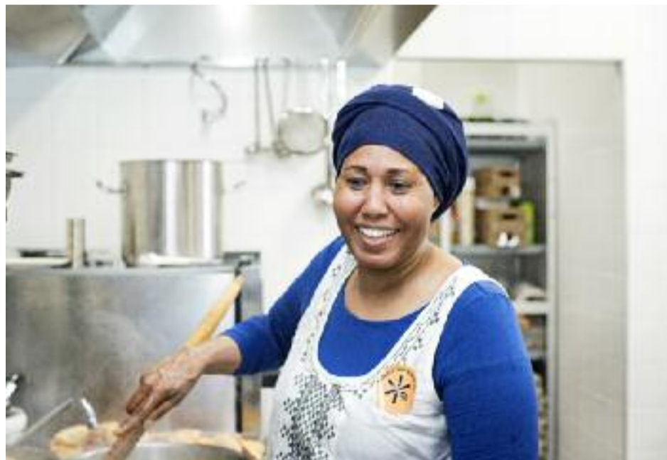
Quand elle a découvert la recette préparée par Isabelle Huppert p.20...

Par exemple, Food for Soul, l'association du chef étoilé italien Massimo Bottura qui cuisine des invendus pour les offrir à des gens dans le besoin dans des lieux rénovés par des artistes. Ou enfin, le Refugee Food Festival qui a reçu le prix de l'événement 2019.