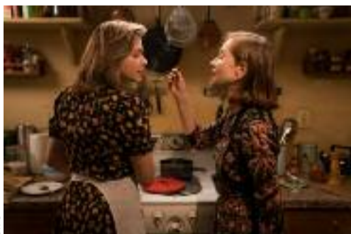
Huppert en Violette Rozières ?

S erveuse à New York, Frances trouve un soir dans le métro un élégant sac à main. Il appartient à Greta, une excentrique vieille Française qui conquiert vite la jeune fille. Frances découvre alors combien Greta peut se montrer intrusive et inquiétante. Mais n'est-ce pas déjà trop tard ? Depuis combien de temps n'avait-il pas été plaisant de voir Isabelle Huppert à l'écran ; c'est-à-dire appelée pour autre chose qu'un rôle lui donnant le prétexte d'être soit une victime à la passivité suspecte pour ne pas dire consentante, soit une épave bourgeoise – les deux n'étant pas incompatibles ? Neil Jordan a eu le nez creux en pensant à elle : d'ordinaire agaçantes, les