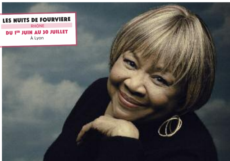
Je penche, donc je suis

C'est un petit moment volé à la grande Histoire de la musique. Dans le film The Last Waltz , documentaire que Martin Scorsese consacre en 1976 au dernier concert de The Band, compagnon de vagabondage de Bob Dylan. Le cinéaste y filme notamment les cinq desperados canadiens jouant sans doute la plus belle version de l'une des plus belles chansons du monde, The Weight . Et si cette version est aussi sublime c'est parce que la voix de Mavis Staples, véritable confit de suavité, y fait son entrée au bout d'une minute. La jeune femme accompagne The Band avec la formation familiale menée par le patriarche Roebuck "Pops", Staples : les Staple Singers – une famille dont les voix, à commencer par celle de Pops semblent tombées d'un pays où « coulent, selon l'expression biblique, le lait et le miel », et où en remerciement on pratique le gospel avec autant de dévotion que de talent.