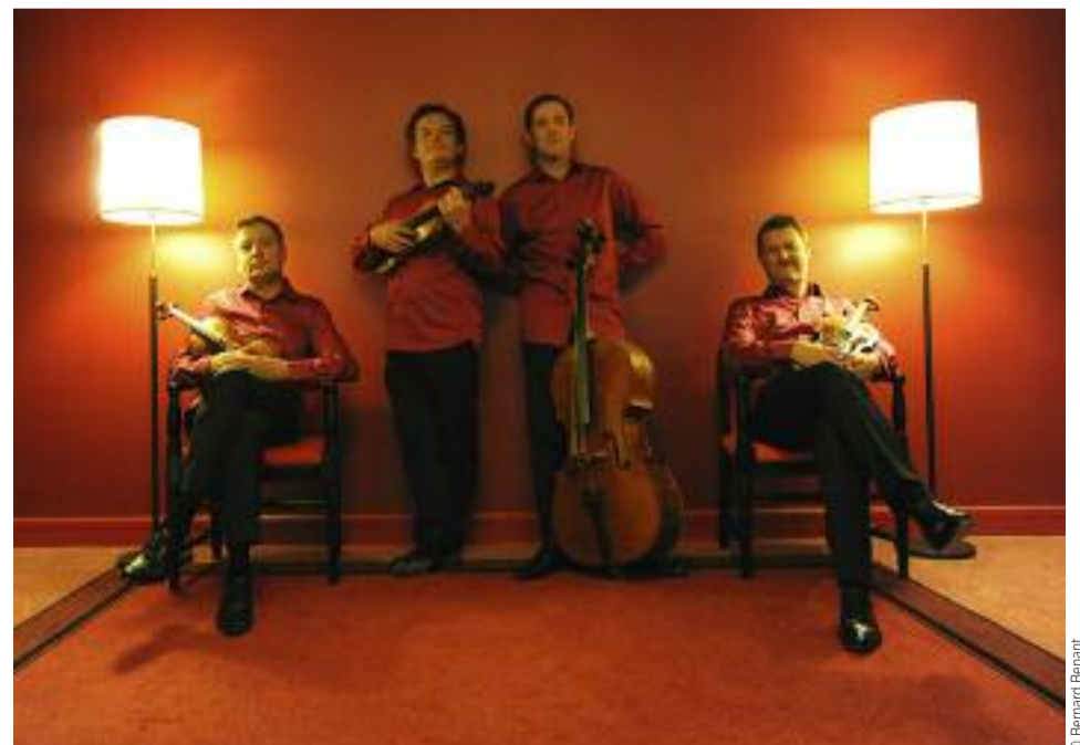
Les Trois Mousquetaires du classique, le Quatuor Debussy, programmé aux Nuits musicales de Corps

HAUTE-LOIRE/PUY-DE-DÔME DU 22 AOUT AU 1 er SEPTEMBRE La Chaise-Dieu, Le Puy-en-Velay et cinq autres communes 04 71 09 48 28 04 71 00 01 16 + ARTICLE P.13