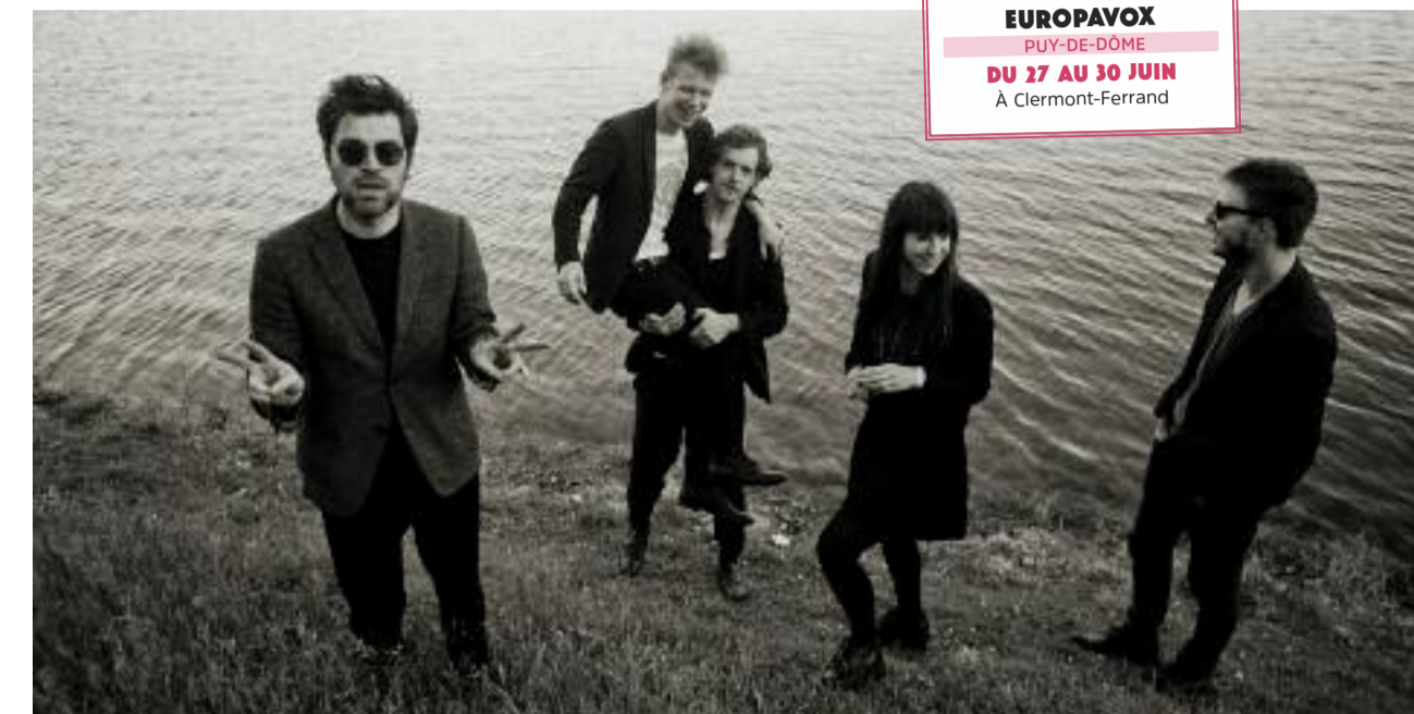
Clermont-Ferrand, ses plages, ses maillots de bains...

Puisqu'on a souvent érigé Balthazar en fils spirituels de Leonard Cohen, alors le virage musical opéré par le groupe belge avec Fever pourrait se rapprocher tout à la fois de l'embarquée philipspectorienne du Beautiful Loser sur Death of a Ladies' Man , des avances de gentleman cambrioleur de cœurs et crocheteur de vertus d' I'm You Man ou des roucoulades sur un monde en ruines de The Future . Pas dans l'empaquetage sonore, oh ça non : rien ici de comparable à l'effet du Wall of Sound sur la musique du Canadien ou au devenir synthétique de ses plaintes jadis folk. Mais bien davantage dans l'intention de s'émanciper de l'aura brumeuse du troubadour traîne-misère. Une tentative de ne pas rentrer à la maison avec le drapeau hissé haut dans le suspens, comme le conseille un des titres de Death of a Ladies' Man , justement ( Don't go home with your hard-on , pour ne pas le