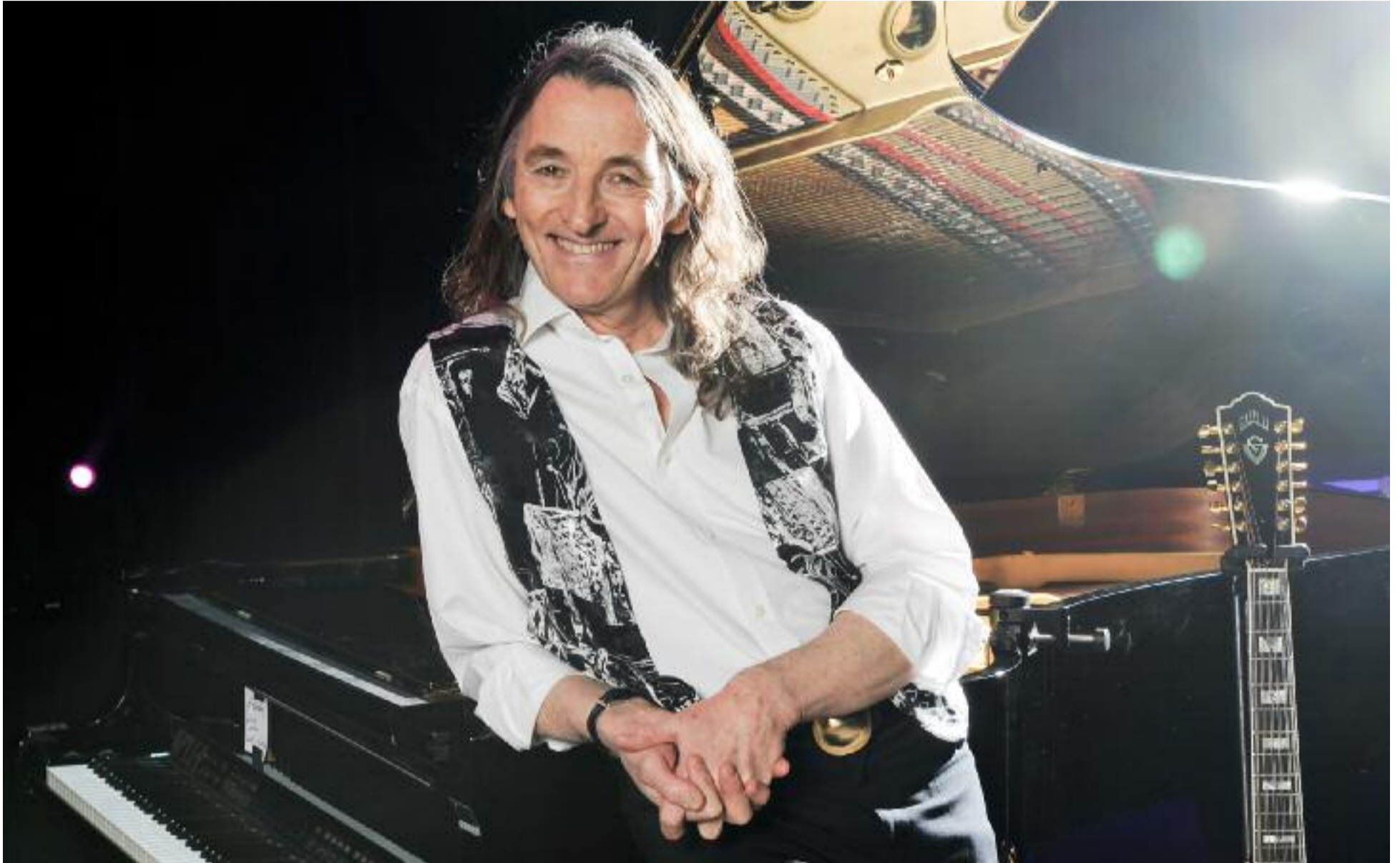
Roger Hodgson

Après Breakfast in America , Pousse-café à Fourvière