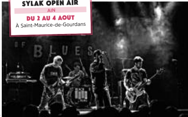
«Y'en a pas un sur cent et pourtant ils existent/ Les Anarchiiiiistes» (Léo Ferre)

E n dépit de l'unanimité faite autour de la bonhomie intrinsèque du fan de hard-rock qui cache derrière ses longs poils, ses tatouages et ses t-shirts appelant à la déchéance du Christ et la démission de Dieu, un cœur de nounours rigolard qui aime son prochain et montrer ses fesses, il ne semblera étonnant à personne qu'au milieu des Severe Torture, Insanity Alert, Burn your Karma, Apocalyptic et Hate – non, la « bienveillance » macronienne n'a pas encore phagocyté l'onomas-tique des patronymes métalliques, c'est toujours ça de sauvé –, ne flotte pas soudainement un drapeau blanc.