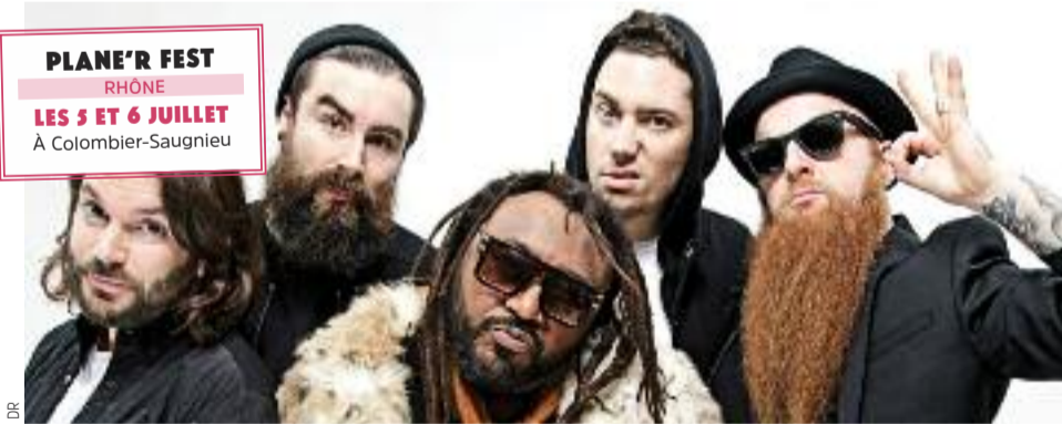
Finale, c'était une soirée barbe