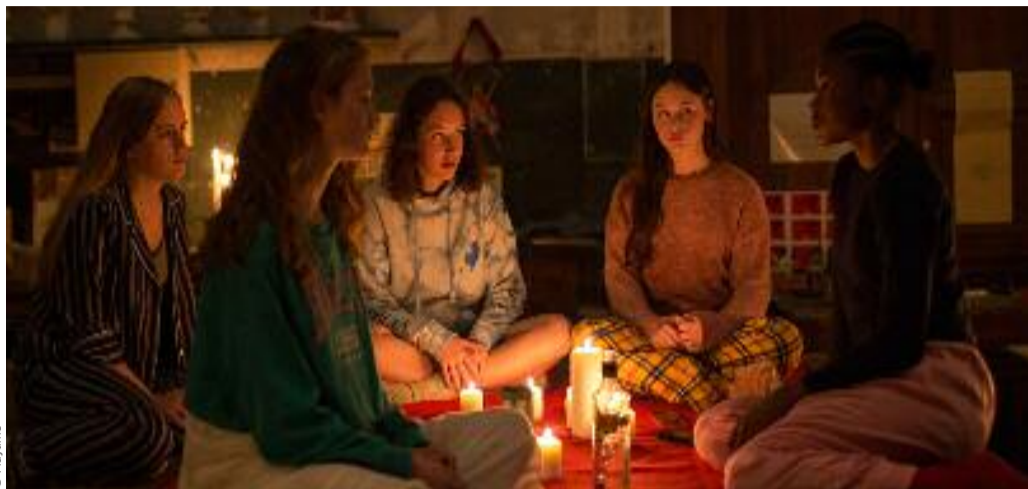
La venue à Lyon de Charlie Adlard a laissé quelques traces...

H aiti, 1962. Un homme en apparence mort est nuitamment déterré puis drogué pour devenir zombi et servir d'esclave dans des plantations de canne à sucre. Saint-Denis, 2017. Sa petite-fille arrive au pensionnat de la Légion d'honneur et conte le destin de son aïeul à ses condisciples... D'un rite, l'autre... Le film s'ouvre sur la cérémonie transformant Clairvius Narcisse en "ouvrier docile", somnambule et mutique, avant de sauter à l'époque contemporaine sur une leçon d'Histoire prodiguée (devant d'attentives élèves en uniforme) par l'universitaire Patrick Boucheron renvoyant à la question des libertés au XIX e siècle – qui fut tout de même celui du colonialisme et de l'exploitation des prolétaires. Dès lors, Zombi Child ne cessera les va-et-vient entre les deux époques et les deux territoires, composant