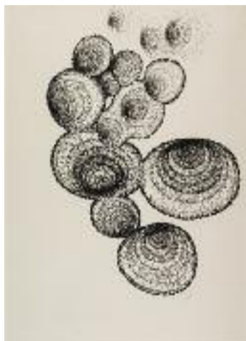
Mangerais bien des coques, tiens !