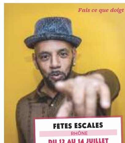
Fais ce que dois

P roposer un festival de trois jours entièrement gratuit : c'est le défi que la Ville de Vénissieux a choisi de relever pour la 21 ème année consécutive. Le 12 juillet, direction l'Amérique latine avec une soirée cumbia. Le groupe Sonido del Monte, dont le concert avait été annulé l'an passé pour cause d'orage, tentera de prendre sa revanche. En prime : la présence de la formation péruvienne des Cumbia All Stars, l'un des plus éminents représentants du genre. Les musiques du monde seront également à l'honneur lors de la soirée de clôture, avec une programmation afro.