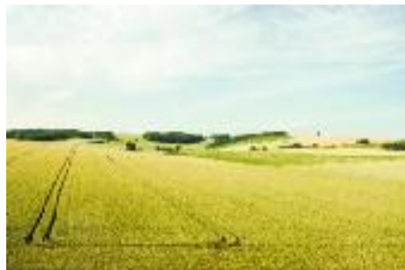
A peine le temps

Oui, il y a aujourd'hui dans nos paysages trop de signes, trop de messages lus, écrits, parlés, trop de mises en garde, trop de promotions sur abonnements, trop de ventes flash, trop de pa-